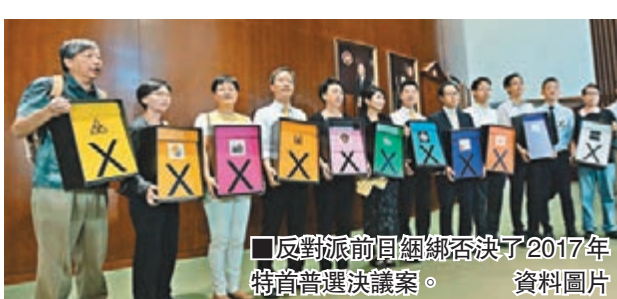
反對派前日綁架否決了2017年特首普選決議案。資料圖片

香港文匯報訊（記者 李自明）香港反對派逆主流民意綁架否決2017年特首普選決議案。全國港澳研究會副會長劉兆佳昨日批評，反對派立法會議員否決政改，是非理性及不明智的決定，此舉可能會令反對派與中央的關係惡化，令他們未來參與社會管治的空間縮小。 劉兆佳昨日在接受中新社訪問時指出，香港的政改進程，必須維護國家利益和國家安全，防止「一國兩制」走向歪路，「對於反對派議員來說，否決政改是在意氣用事，這不是理性、明智的決定，對反對派來說沒有太多好處。」 與中央關係惡化 內部更分化 劉兆佳分析指，反對派否決普選決議案，可能給他們帶來3個影響：與中央的關係很難改善甚至還會惡化；未來參與社會管治的空間將縮小；證明用激烈手段逼使中央讓步的設想不具任何可能。 他說：「反對派未來政治空間可能越來越小，或導致他們進一步分化。某種程度上，違背民意的做法也會減少一部分香港人對他們的支持。否決政改，反對派犧牲了長遠發展，只是換取了短期的政治利益。」 被問及政改之後的社會發展，劉兆佳認為，應從提高政府管治能力入手。雖然特區政府當前遇到一些管治問題，但不應誇大政府的管治難度，香港也遠未出現「管治危機」。 他說：「下一步，特區政府應走一條容納社會各階層的施政路線，爭取更多人加入愛國愛港陣營。同時，（特區）政府應解決社會矛盾，減少社會貧富差距懸殊，為年輕人提供更多發展的可能性，讓更多民眾分享到經濟發展帶來的好處。」