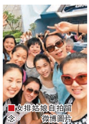
女排姑娘自拍留念。

中國女排已於日前結束美國排球盃的比賽返回北京。不過，在美期間，女排姑娘也有輕鬆的一面。據鳳凰體育消息，在最後一場比賽前夕，中國女排忙裡偷閒到迪士尼樂園一日遊。近期表現搶眼、「朱元璋」成員之一的張常寧，更將遊玩照片放上微博。