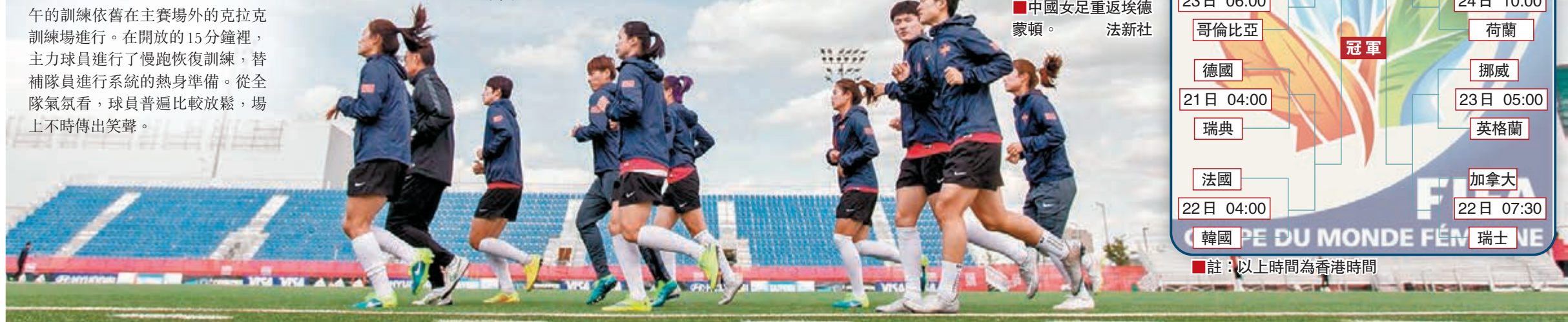
中國女足重返埃德蒙頓。