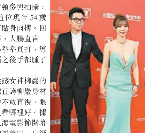
■柳巖性感深V造型亮相。

香港文匯報訊（記者 孔雲瓊 上海報道）上海電影節中的電影類傳媒大獎入圍影片《煎餅俠》昨日在滬進行了放映式，導演兼主演大鵬和性感女星柳巖一同到場和觀眾進行交流。大鵬同時還透露拍攝過程中，只因柳巖太過性感，讓他眼睛不知往哪裡看。昨日在《煎餅俠》放映過程中，全場笑聲共304次，不過喜劇之中也含有驚險動作鏡頭，此次大鵬力邀荷里活巨星尚格雲頓參與拍攝，並在片中和這位現年54歲的動作明星有貼身肉搏。回憶起拍攝過程，大鵬直言一個慘字，因為拳拳真打，導致他拍了兩遍之後手都腫了起來。在談起與性感女神柳巖的合作時，大鵬直誇柳巖身材好，拍攝之中不敢直視，眼睛完全不知道看哪裡好。據悉，在之前上海電影節開幕紅毯秀上，柳巖就以一身深V造型禮服成功搶鏡。