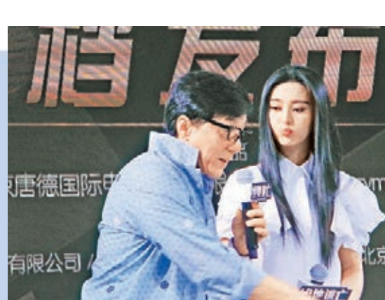
■范冰冰盡顯調皮「侄女」的姿態。