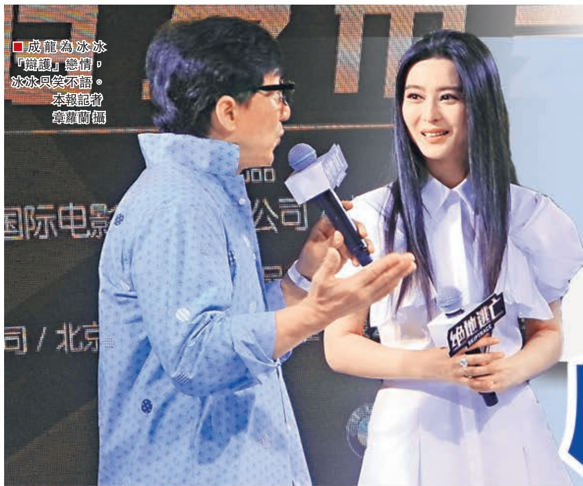
■成龍為冰冰「辯護」戀情，冰冰只笑不語。