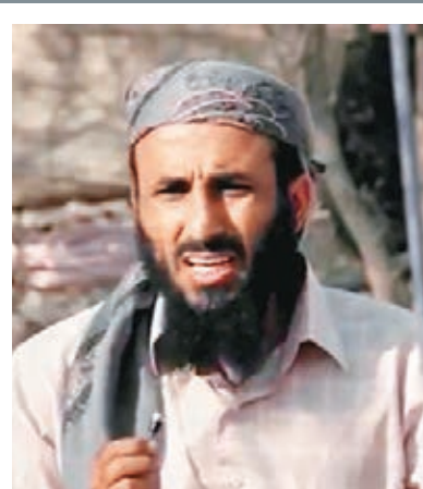
武海希遭美軍擊斃。路透社