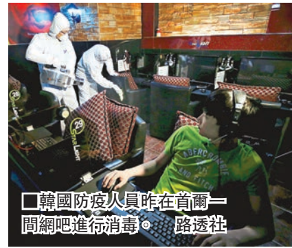
韓國防疫人員昨在首爾一間網吧進行消毒。