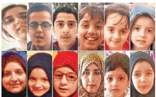
達烏德姊妹與9名子女一同失去聯絡。網上圖片