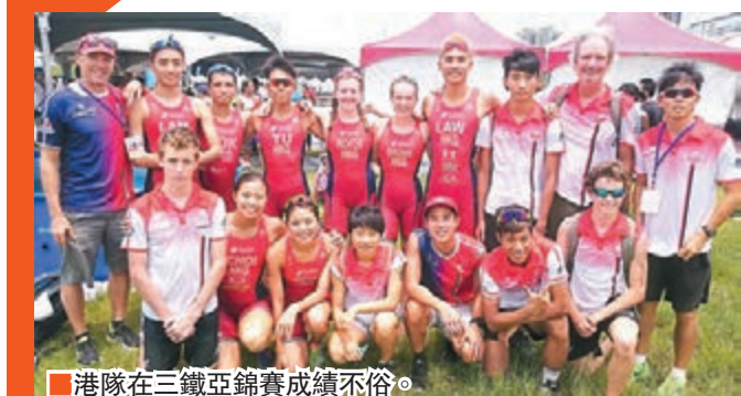
■港隊在三鐵亞錦賽成績不俗。