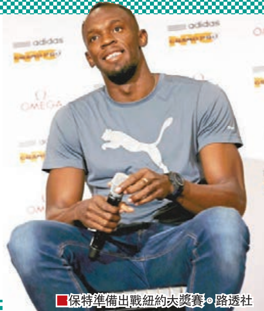
■保特準備出戰紐約大獎賽。

較個人保持的19秒19的世界紀錄差距不小。保特表示，正在慢慢調整狀態，改善技術，訓練十分刻苦，他說：「我明天的目標是跑進20秒，估計差不多，我感覺我的狀態開始上來了。等到北京世錦賽時，我認為能夠回到最佳狀態。」紐約的伊坎體育場對保特具有特殊意義，7年前，保特在該個場館以9秒72的成績贏得冠軍，創造個人首個世界紀錄。