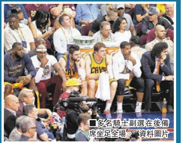
■多名騎士副選在後備席坐足全場。資料圖片