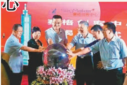
■賽格創客中心昨日成立。

而在租金方面，賽格創客中心對於首批入駐的團隊提供免租一個月的優惠，同時也會對項目進行甄別，好的項目不僅享有租金減免，還有可能以租金換股權等合作方式。