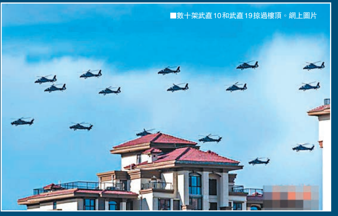
■數十架武直10和武直19掠過樓頂。

距離9月3日舉行的反法西斯抗戰勝利閱兵只有不足3個月時間，閱兵訓練綵排等工作不斷提速。