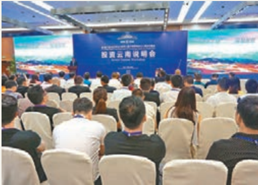
■第3屆中國—南亞博覽會投資雲南說明會12日在昆明舉行。

目前，中國華信能源有限公司、以色列化工、北京大地遠通集團、上海復星高科技集團、曲靖建材有限公司等6家民營企業及外資企業，分別與雲南省國資委和雲南國有企業簽訂了發展混合所有制的合作協議。