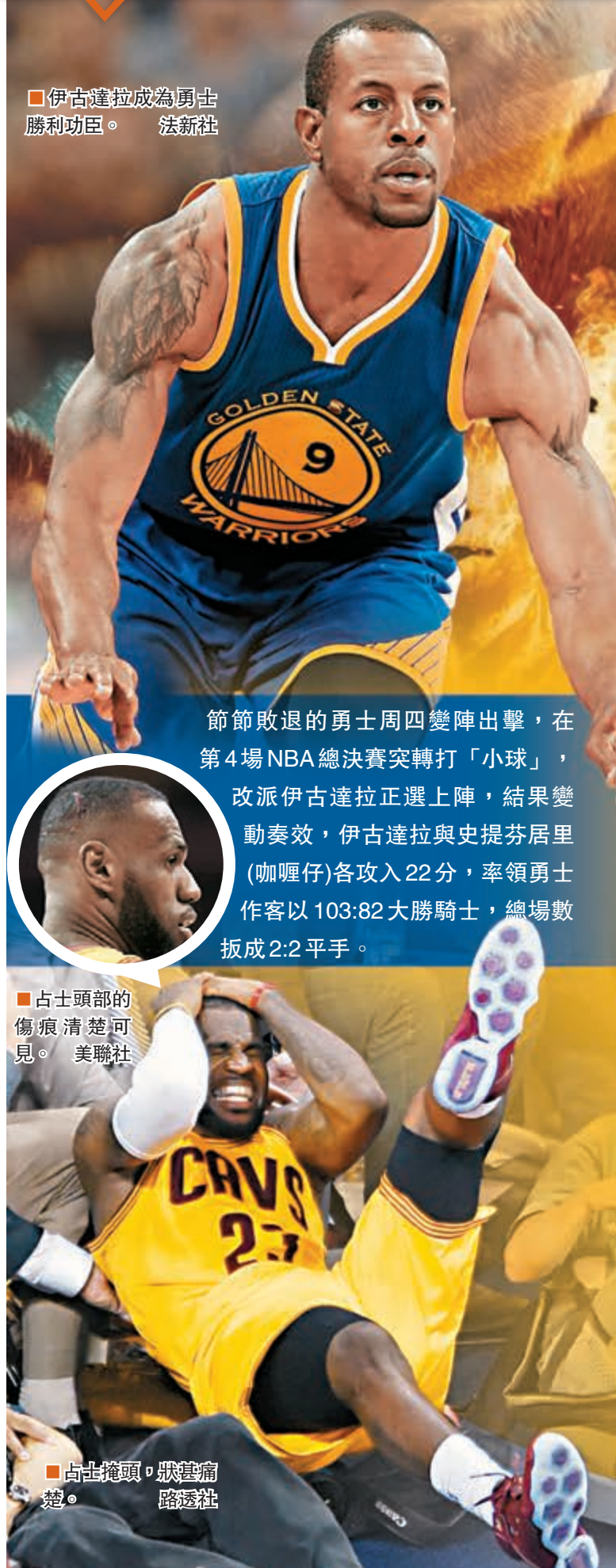
■伊古達拉成為勇士勝利功臣。

節節敗退的勇士周四變陣出擊，在第4場NBA總決賽突轉打「小球」，改派伊古達拉正選上陣，結果變動奏效，伊古達拉與史提芬居里(咖哩仔)各攻入22分，率領勇士作客以103:82大勝騎士，總場數扳成2:2平手。