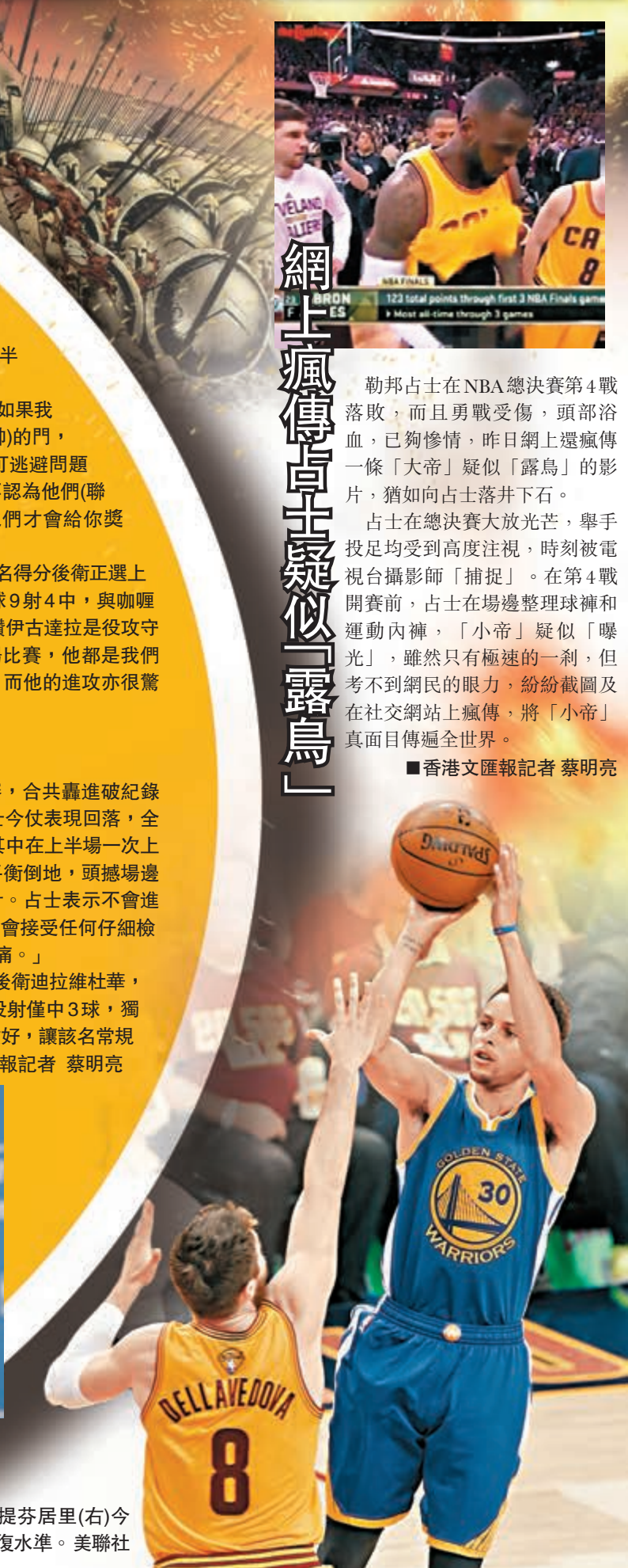
■史提芬居里(右)今仗恢復水準。