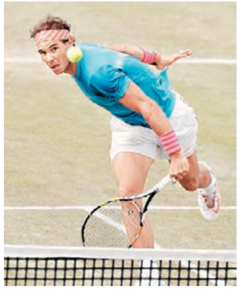
■新華社 拿度拍走巴格達迪斯。法新社

今場比賽是拿度本季的首場草地賽事，此前與巴格達迪斯8次交手，拿度贏了7次，雖然今仗贏球過程不太順利，但拿度還是很開心用一場勝利走出法網8強不敵高域的陰影。現世界排名跌到第10位的拿度說：「我很高興獲得這場勝利並晉級8強，巴格達迪斯是一個難纏的對手，這場比賽增長了我的信心。」拿度下場將面對5號種子湯米奇。