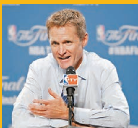
■卡爾兵不厭詐。

另外，在第3仗戰至腿部嚴重抽筋的騎士後衛迪拉維杜華，周四趕及復出，不過攻守表現欠佳，14次投射僅中3球，獨取10分，而防守史提芬居里的工作亦未有做好，讓該名常規賽MVP重拾手感。