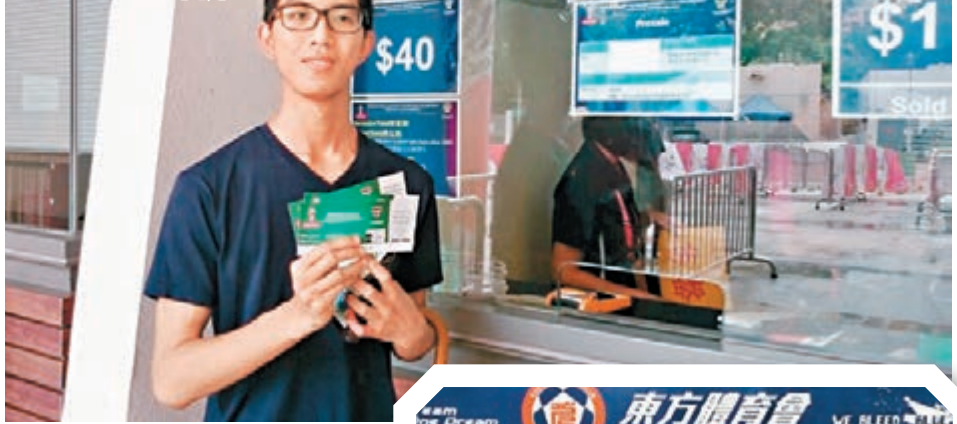
■李先生成功買下最後3張門票。

至於港隊身處的C組，另外一場賽事亦已完成，出線大熱卡塔爾憑藉補時階段的入球，作客以1:0險勝馬爾代夫，而中國隊首輪輪空，令港隊以得失球優勢暫居榜首。