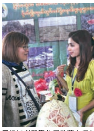
邊城瑞麗聚集了數萬名緬甸及巴基斯坦、印度、斯里蘭卡、尼泊爾籍人員從事各種職業，有人形容，在瑞麗遇上4個人，就有一個外國人。

5月27日開通的昆明—達卡定期國際貨運航線，打通了雲南面向「孟中印緬」經濟走廊的貨運大通道，實現了雲南與孟加拉國之間國際貨物的快速雙向中轉，必將加快雲南與南亞地區的商務交流、貿易往來。目前，昆明機場航線網絡已覆蓋東南亞7國和南亞5國，每周162個航班往返東南亞、南亞，成為中