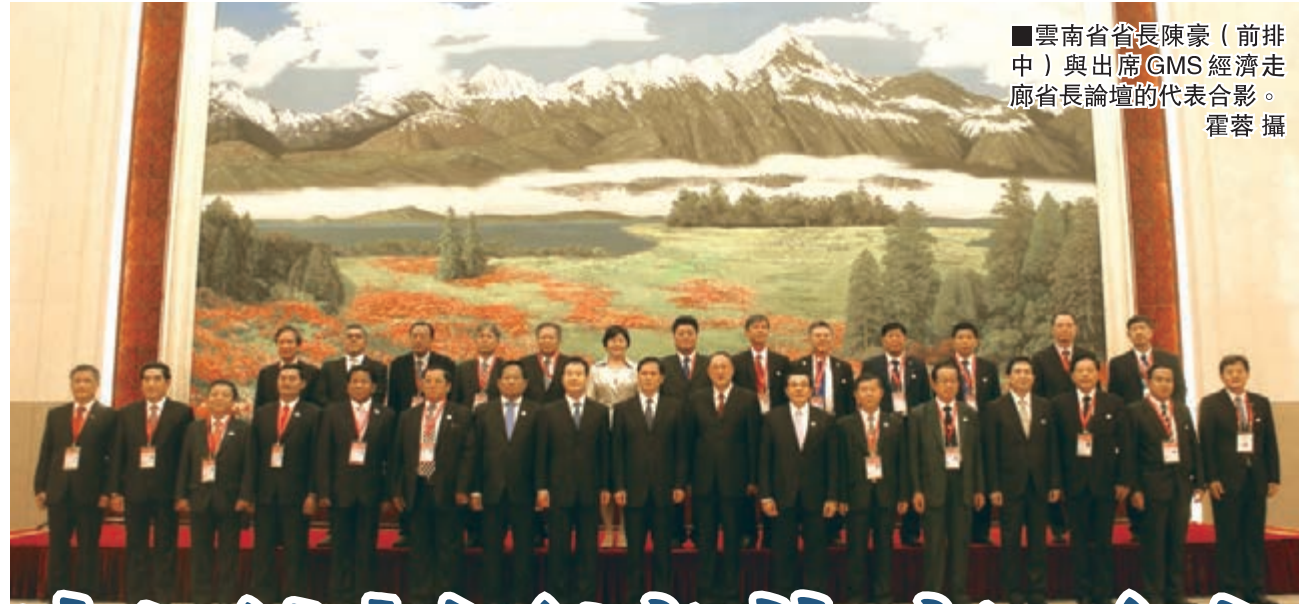
雲南省省長陳豪(前排中)與出席GMS經濟走廊省長論壇的代表合影。

高效配置和市場深度融合，從而推動沿線各國實現經濟政策協調，開展更大範圍、更高水平、更深層次的區域合作，共同打造開放、包容、均衡、普惠的區域經濟合作框架，大湄公河次區域可將「一帶」與「一路」有機聯繫起來，在「一帶一路」建設中打造中國—東盟合作的升級版，更有效地促進政策溝通、設施聯通，貿易暢通、資金融通，民心相通，更深入地推進產業互補、經濟融合和文化交流，使次區域地區經濟更活躍，交流更加頻繁，成果