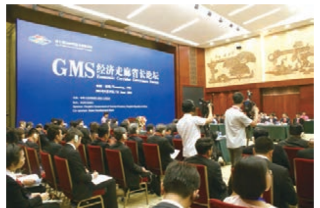
本屆GMS經濟走廊省長論壇主題為「建立更加緊密和積極的長期夥伴關係」。

去年，中國國家主席習近平提出了與沿線各國共建「一帶一路」的倡議，旨在促進經濟要素有序自由流動，資源