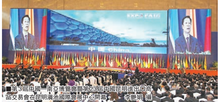
第3屆中國-南亞博覽會暨第23屆中國昆明進出口商品交易會在昆明滇池國際會展中心開幕。

香港文匯報訊（記者 李麗娟 昆明報道）12日，第3屆中國-南亞博覽會暨第23屆中國昆明進出口商品交易會在昆明滇池國際會展中心開幕，國家副主席李源潮出席開幕式。