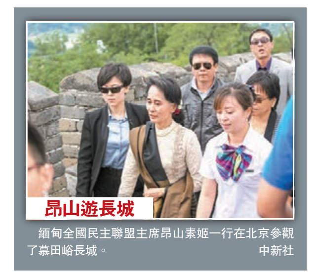
昂山遊長城 緬甸全國民主聯盟主席昂山素姬一行在北京參觀了慕田峪長城。

鍾山說，內地的跨境電子商務以及電子商務總的來說發展是非常快，今年1-4月份，內地的電子商務和跨境電子商務銷售額已經超過4.4萬億人民幣，增長20%。跨境電子商務越來越被廣大的消費者、企業認可和接受。