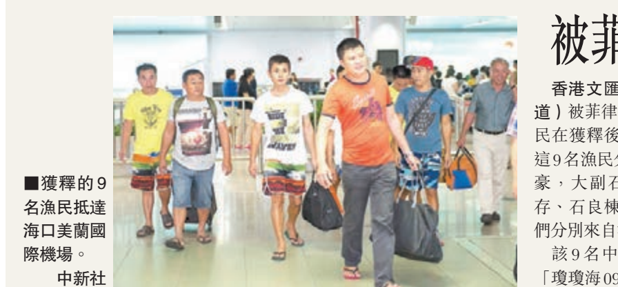
獲釋的9名漁民抵達海口美蘭國際機場。

洪磊就此表示，中方在緬北問題上的立場是明確的，我們支持緬甸國內各方通過和談方式解決分歧，早日實現國內和平與民族和解，共同維護中緬邊境穩定。這符合中緬雙方共同利益。洪磊說，「為此，中方根據雙方意願積極推動緬北和平進程發揮建設性作用，並受到緬方歡迎。今後中方將繼續為此發揮積極作用。」