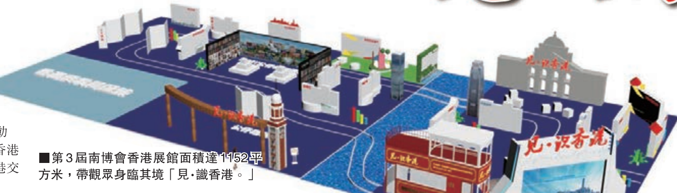
■第3屆南博會香港展館面積達1152平方米，帶觀眾身臨其境「見·識香港。」