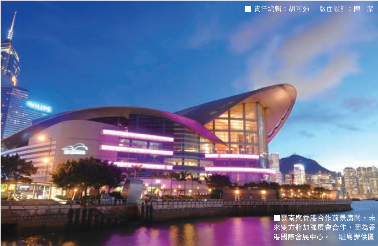
■責任編輯：胡可強 版面設計：陳潔