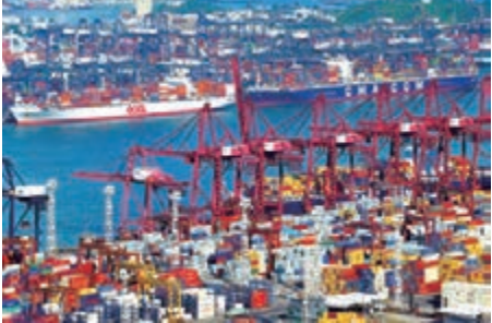
■香港在「一帶一路」的將扮演三角色，圖為香港葵青貨櫃港，該港是全球最繁忙貨櫃港之一。

雲南省到外資總量的六成，是雲南省最大的外商投資來源地。近年來，港資進入雲南的規模與質量迅速提高，僅2014年，港商投資雲南的到投資金就近20億美元，同比增長近14%，創歷史新高。同時，香港在雲南貿易格局中也佔有重要位置，是雲南最大的貿易夥伴。據不完全統計，香港市場1/2的花卉和1/3的蔬菜來自雲南。