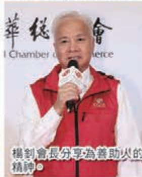
橫創會長分享為善助人的精神。