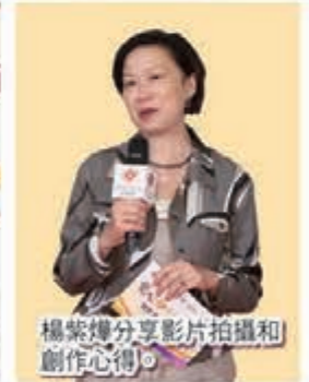
楊紫燦分享影片拍攝和創作心得。