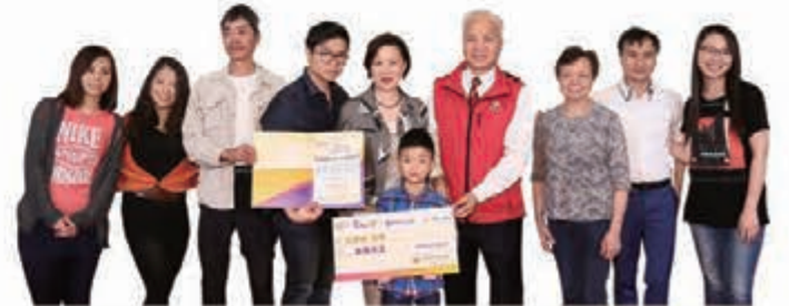
公開組冠軍作品《只要·多一點》同時囊括創意無限、愛心洋溢、至 Like 人氣三個獎項。

得獎名單及作品可於中總愛心之歌短片創作比賽網站欣賞 http://cgcc.m21.hk