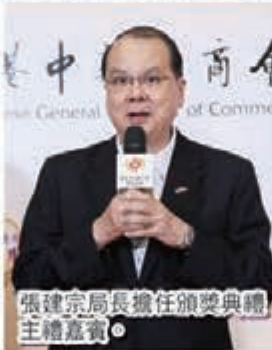
張建宗局長擔任頒獎典禮主禮嘉賓。

學生組冠軍由來自香港潮商學校的製作團隊以短片《潮商 x 愛心之歌》奪得，作品透過關懷社區及身邊人的點滴故事傳遞服務社會的熱忱。公開組冠軍作品《只要·多一點》更同時囊括創意無限、愛心洋溢、至 Like 人氣三個獎項，短片以日常助人行動把不同背景的人巧妙聯繫起來，帶出關愛助人不因身份有別的大愛精神。