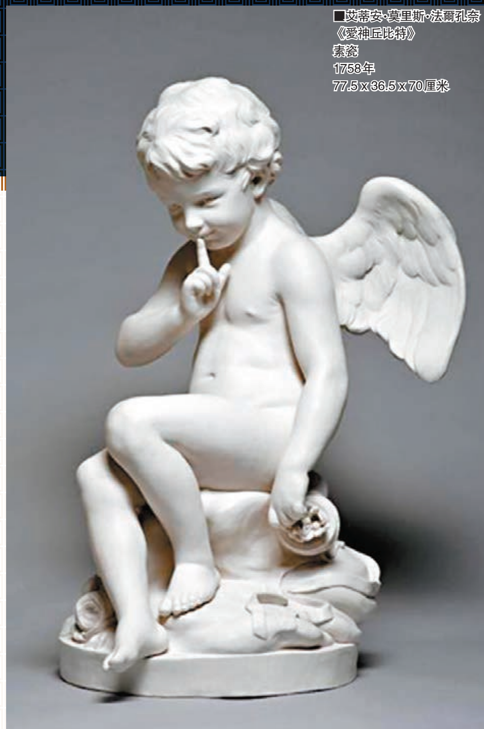
■艾蒂安·費里斯·法爾孔奈 《愛神丘比特》 素瓷 1753年 77.5 x 66.5 x 70 厘米

面對一件於1808年製作的盤子《Plate with Egyptian Decoration》時，塞夫爾國家陶瓷製造局執行總裁羅曼·沙爾法蒂解釋說盤子邊緣的金色飾邊是象徵性的藝術表達，類似於某種圖騰，而盤中作畫卻是描繪歐洲當代城市的景象，傳統與當代在這一工藝品中交匯，更體現出了製瓷工藝中傳統與當代語言的交匯。