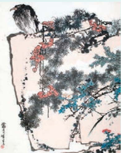
■鷹石山花圖，潘天壽畫作。

得注意的是，過去幾年中，大部分潘天壽的重要作品都是在中國嘉德的大觀夜場中呈現。這幅《鷹石山花圖》是潘天壽60年代的博物館級創作，更是新中國美術史上重要的里程碑。從中國畫畫的整體的成交結果可以看出，未來尖端藝術品的成交趨向樂觀，同一作家的作品，會依據其作品的精彩、稀有程度，不斷拉大差距，選擇正確的時間點和正確的平台，相信會體現出名家精品應有的價值和光芒。