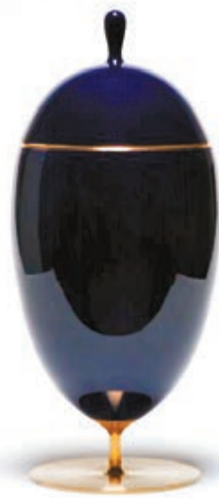
■米歇爾·德·盧基 《神秘之杯》 釉瓷、鍍金銅 2011年 42.9 x 19 厘米