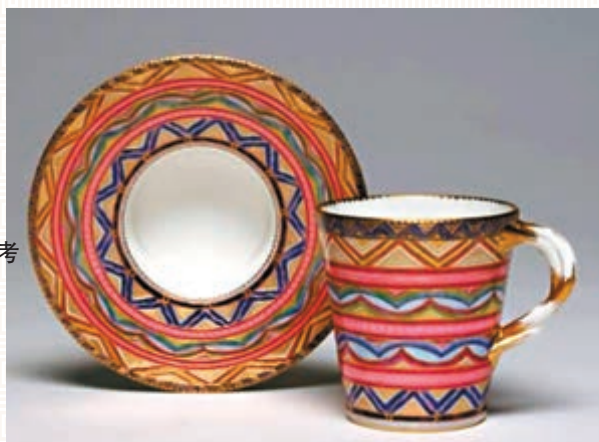
■讓-弗朗索瓦·米考 《深口杯碟》 施釉及軟質瓷 1765年 杯：9 x 8 cm 碟：4.2 x 14.7 cm

富的可能性。」羅諾德講解時指出，塞夫爾的色盤擁有變化無窮的藍色韻律，其中1778年被定義的「塞夫爾藍」，即是用大火將一層薄釉燒至136度時，藍色退卻為瑪瑙藍，不規則的上釉則能燒出雲幻藍色，而當瓷器上三層釉時，就能看到製造局的標誌性「藍」。