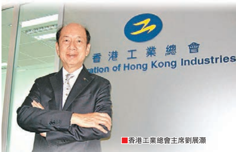
香港工業總會主席劉展瀨