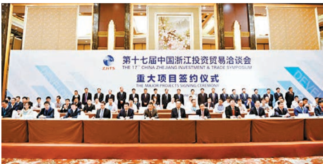
浙洽會重大項目簽約儀式現場。