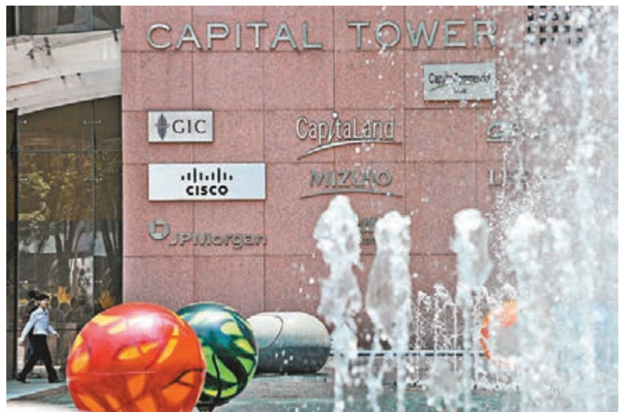
■配售後方興地產控股股東當中GIC的股權,由3%增至6.54%。資料圖片

至於另一內房企方興地產,向新華保險等上述投資者配售股份的配股價為2.73元,較公司停牌前收市價