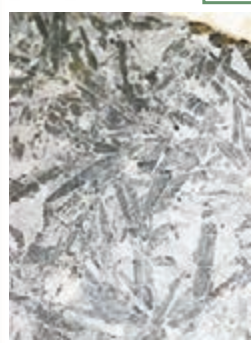
木化石有清晰的植物紋理。本報重慶傳真

近日，在重慶北碚一處碎石堆積區裡，有市民發現木化石和大量炭類植物化石，經重慶自然博物館專家初步推測，這些化石來自距今2.5億年前的二疊紀時期，比恐龍出現的侏羅紀至少早5,000萬年。而這次發現的木化石在重慶主城也是首次。