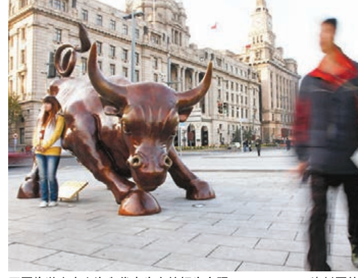
圖為遊客在上海與代表牛市的銅牛合照。資料圖片

據華爾街日報報道指出，中國已超越美國成為全球最大的首次公開募股(IPO)市場，今年以來中資企業在滬深和香港股市的IPO資金達290億美元，超