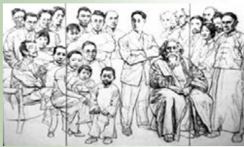
成都畫家高小華創作的徐志摩「朋友圈」群像。

近日，在藝術家高小華西南民族大學的工作室裡有一幅特殊的作品：三聯作的油畫草稿上，泰戈爾、胡適、梁啟超、徐悲鴻、沈從文、魯迅、張幼儀、林徽因、陸小曼……這些人物栩栩如生，不動聲色而又驚心動魄地揭示着徐志摩的豪華朋友圈。