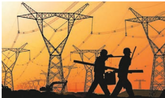
中國將加快健全能源監管體系。