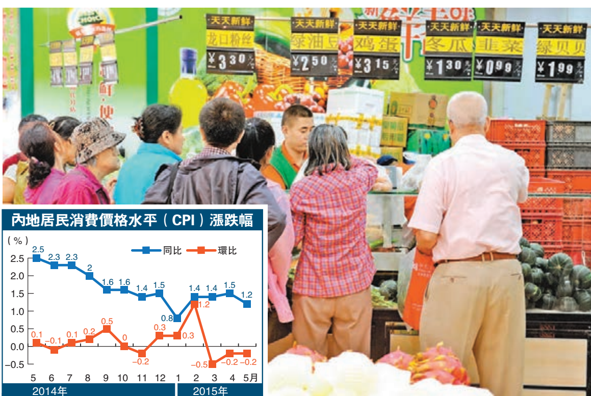
內地連續8個月處於低於2%的低通脹水平。圖為吉林長春市民在一家農貿市場排隊購買蔬菜。

謝亞軒預計，下半年央行仍有可能再次調降基準利率，同時放開存款利率上限，完成利率市場化改革。此外，隨着跨境資金流入規模較往年趨勢性減少，央行仍可能繼續降準，並配合使用多種政策工具。