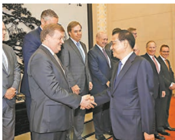
李克強會見來華出席全球首席執行官委員會第三屆圓桌峰會的主要代表。

全球首席執行官委員會第三屆圓桌峰會由中國人民對外友好協會主辦，來自14家全球500強跨國企業的董事長、首席執行官等代表出席。