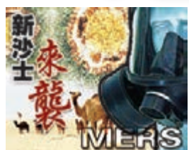
香港文匯報訊 (記者 文森)

韓國中東呼吸綜合症疫情持續，港府繼衛生署前日發出旅遊健康建議後，保安局昨日再對韓國發出紅色外遊警示，呼籲市民如非必要應避免前赴韓國。香港旅遊業議會昨晨與各大營運韓國團的旅行社開會後決定，取消所有本月底前出發的韓國旅行團，預計最多有1.2萬名旅客受到影響，旅客可按機制取回全部款項，或保留團費半年。另外，國泰及港龍航空、香港快運均公布特別票務安排，容許旅客退票或更改目的地。不過有旅行社指出，韓團受挫或令旅客改赴鄰近地區旅遊，料旅行團費用會增加一成。