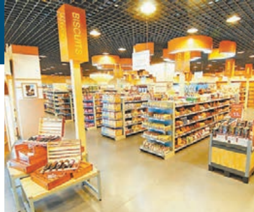
中東歐16國的3000多商品集聚寧波。