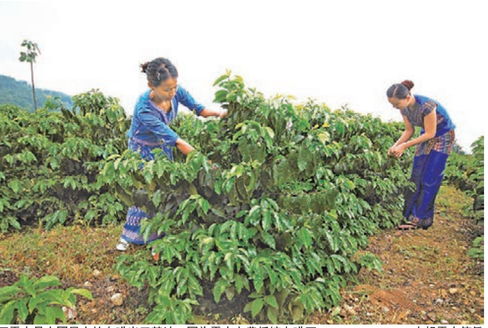
雲南是中國最大的咖啡出口基地。圖為雲南咖農採摘咖啡豆。本報雲南傳真

香港文匯報訊(記者李艷娟 昆明報道)7月1日起,歐洲咖啡客戶15天內就能收到來自雲南的上好咖啡。近日,昆明鐵路局與德宏後谷咖啡有限公司聯合打造的昆明至歐洲(滇新歐)咖啡國際貨運專列簽約儀式在昆明舉行,此舉填補了雲南咖啡無國際鐵路貨運的空白,同時該專列也是雲南首次到達歐洲的專列。