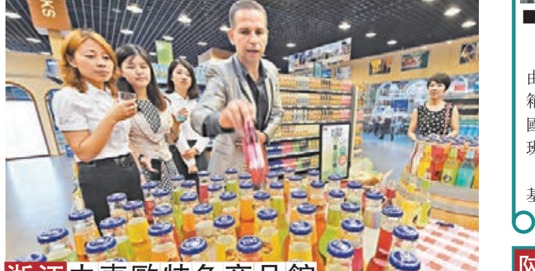
浙江中東歐特色商品館昨日,浙江寧波中東歐國家特色商品館在寧波國際會展中心開館。作為首屆中國—中東歐國家投資貿易博覽會的重要組成部分,中東歐國家特色商品館佔地1,000多平方米,主要展示和銷售中東歐國家的特色商品。■新華社

黑龍江 香港文匯報訊(記者王心者 哈爾濱報道)昨日,記者從有關部門獲悉,「2015中俄(哈爾濱)文化博覽會暨北大荒文化產品展示交流會」將於本月11日至15日在黑龍江哈爾濱國際會展中心舉行。屆時,包括中俄在內的數十家企業將採用展覽推介、招商洽談、藝術品鑒賞等多種形式,推進中俄兩國文化產業的交流與合作。 與其它文博會不同的是,「2015中俄(哈爾濱)文化博覽會」將突出展示具有鮮明黑龍江墾區特點的「北大荒文化」,共展出四大類上千餘種產品,全面表現墾區獨有的地域經濟文化變遷和人文情懷。