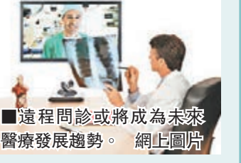
遠程問診或將成為未來醫療發展趨勢。網上圖片

網絡醫院 香港文匯報訊(記者路艷 寧貴州綜合報道)生病不用去醫院排隊,只需要在藥店與醫生視頻交流,就可以在線問診並得到藥方,並在現場直接抓藥——網絡問診未來將在貴州貴陽成為現實。日前,貴陽市人民政府、百度在線網絡技術(北京)有限公司與貴陽朗瑪信息技術股份有限公司簽訂協議,三方將整合貴陽市醫療資源,打造貴陽互聯網醫院,並通過專門科室為居民提供就近便利的遠程診療服務。 根據協議,三方將合作成立醫院集團,形成覆蓋「市(三甲)+縣(二甲)+鄉鎮、社區+村、居」的多層次醫療服務結構體系;打造市民的健康顧問,逐步推進網絡問診平台建設;整合醫療資源,建立分層次的網絡醫療服務能力體系,提升貴陽市醫療服務水平;開展線上品牌推廣活動,打造面向全國具有全球影響力的互聯網醫院高端品牌。