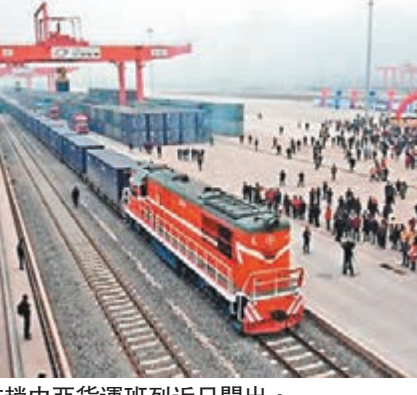
首趟中亞貨運班列近日開出。本報重慶傳真

香港文匯報訊(記者楊毅 重慶報道)重慶首趟中亞貨運班列近日從團結村鐵路集裝箱中心站出發,開往哈薩克斯坦和烏茲別克斯坦。據了解,該趟班列共計10個集裝箱,出口貨物為玻璃熔爐設備和其他機器零件,貨值達1,100萬元人民幣,沿途將經過塔吉克斯坦、吉爾吉斯斯坦和土庫曼斯坦三個國家,抵達哈薩克斯坦需要5天,到達烏茲別克斯坦需要9天。 與渝新歐班列的貨物由政府組織不同,此次中亞班列主要由重慶中亞物流有限公司經營,貨源也由企業自行組織並申報,採用「集裝箱整車」的方式發車。「就中國與中亞地區的貿易交流情況來看,當地對中國的建材、傳統用品、機械製品和戰略資源需求很高,所以,這次中亞貨運班列的開行,非常有潛力。」重慶中亞物流有限公司負責人表示。 另據悉,隨着中伊鐵路的建設開通,重慶中亞班列還將延伸到阿富汗及巴基斯坦。