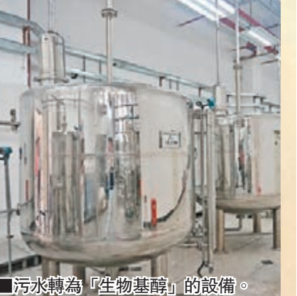
污水轉為「生物基醇」的設備。

綠色能源 香港文匯報訊(記者李薇 深圳報道)由聯合國南南全球技術產權交易中心(深圳)股份有限公司主辦的「高濃度有機污水轉化生物基醇燃料」國家級專家項目驗收會近日在廣東深圳舉行。 據了解,隨着大城市人口的激增和經濟持續發展,工業污水和生活污水排放量日益增加,這些有機污水均具有高毒性、高污染、高有機物的特徵,處理不當將造成環境嚴重污染。在這樣的情況下,由聯合國南南全球技術產權交易中心牽頭研發的「高濃度有機污水轉化生物基醇燃料」項目受到國家各部門的重視。深圳華聯世紀生物工程股份有限公司在經歷8年多的研發後,一款環保、清潔、可再生的綠色能源材料「生物基醇」(新型環保燃料)在內地首次亮相。 據悉,目前該項目已在浙江省投產。而深圳市將於下月在老虎坑垃圾填埋場啓動試用。