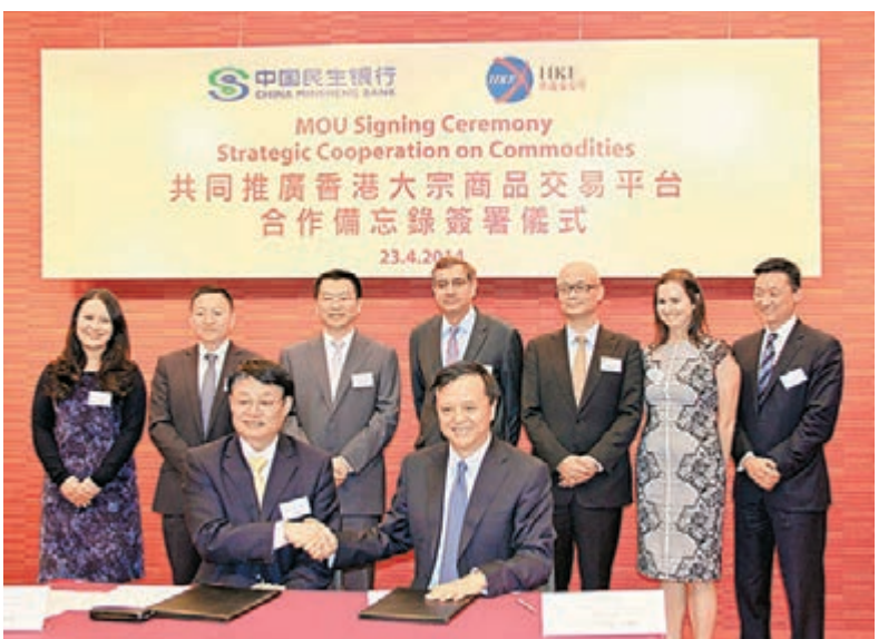
■中國民生銀行香港分行與香港交易所簽訂戰略合作備忘錄。