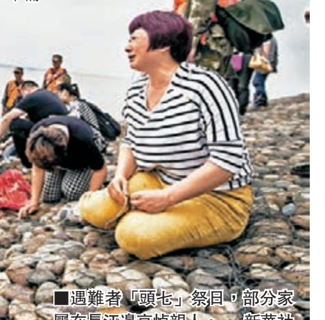
■遇難者「頭七」祭日，部分家屬在長江邊哀悼親人。

此外，對於「東方之星」號沉船能否留在監利縣，黃鎮說，他們也在向上級請示中，包括與重慶市及東方輪船公司進行協商，會根據上級批覆，作下一步計劃。該縣已安排縣檔案局和檔案館，着手收集整個事件救援的相關資料，為今後建館作相關準備。