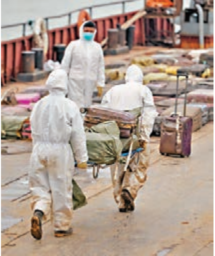
■搜救人員將遇難者遺物轉運出船。

另據新華社報導，交通運輸部部長楊傳堂7日主持召開工作會，要求繼續全力加強遇難者遺體搜尋工作。他表示，當前的中心工作仍是全力以赴搜尋遇難者遺體，要認真清理難船，逐個房間逐個角落排查，確保無遺漏，無隱患。同時繼續組織潛水員在沉船水域進行探摸，加強沿線水域搜尋工作。