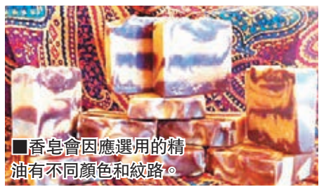
■香皂會因應選用的精油有不同顏色和紋路。

店選用全天然精油混和母乳，加上工序繁複，一塊3磅的母乳香皂要售60美元(約465港元)。