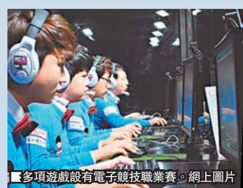
■多項遊戲設有電子競技職業賽。

職業玩家在韓國很受歡迎，不少更加韓星般擁有很多「粉絲」。一些頂尖的團隊更有專人照顧起居飲食，甚至會有贊助商支付全額醫療開支。