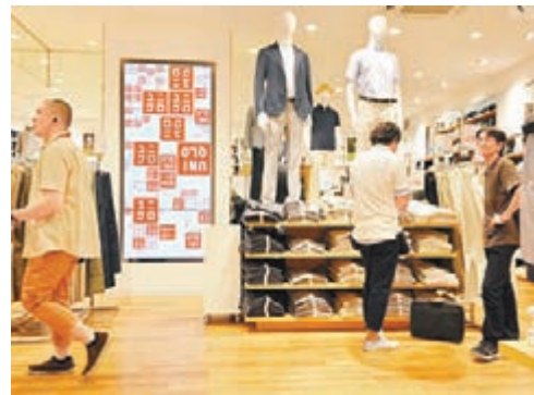
日本服飾品牌UNIQLO，藉由平價、高質感的品牌形象，創造出獨特的穿衣哲學和購物經驗。資料圖片

舉例來說，台灣消費者所熟知的日本服飾品牌UNIQLO，藉由平價、高質感的品牌形象，創造出獨特的穿衣哲學和購物經驗，就是「品牌及通路護城河」的代表，在2004年12月至2015年03月逾十年的時間內，其股價上漲584.86%，是同期間日經指數的9倍，即使金融海嘯期間股價照樣逆勢上漲，這樣的