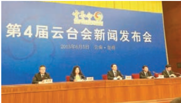
第4屆雲台會新聞發布會昨舉行。

香港文匯報訊(記者譚曼煦昆明報導)記者從第4屆雲台會新聞發布會上獲悉，第4屆雲台會將於下周三(6月10日)至13日在雲南省昆明、玉溪、紅河和大理等地舉辦。會期料將有20餘合作項目