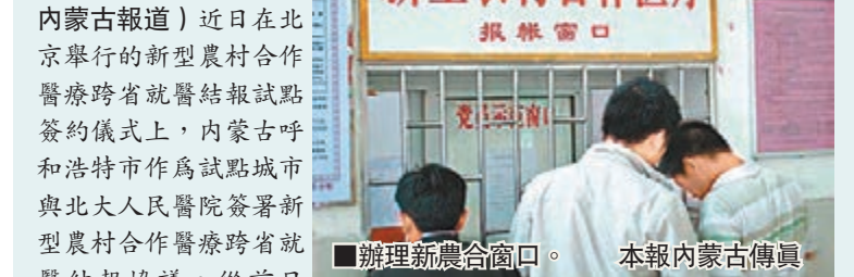
辦理新農合窗口。本報內蒙古傳真

香港文匯報訊(記者 郭建麗、實習記者 白明珠 內蒙古報導)近日在北京舉行的新型農村合作醫療跨省就醫結報試點簽約儀式上,內蒙古呼和浩特市作為試點城市與北大人民醫院簽署新型農村合作醫療跨省就醫結報協議。從前日起,凡呼和浩特市符合條件的外轉參合患者,在北大人民醫院即可按照協議,享受與在本地點醫療機構就診同樣的即時結算服務。