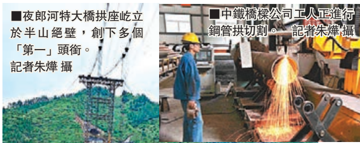
■夜郎河特大橋拱座屹立于半山絕壁,創下多個「第一」頭銜。