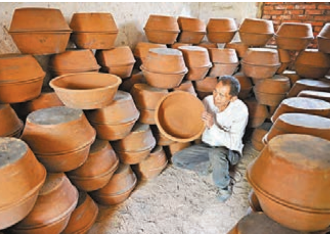
江蘇土陶製作瀕失傳

香港文匯報訊(記者 熊曉芳 西安報導)記者日前從陝西省政府新聞發佈會獲悉,陝西全面推行「陽光信訪」制度,通過「網上信訪」等深化信訪工作制度改革,2014年全省信訪形勢出現了信訪總量、來省信訪量、來省集體訪量、進京訪量下降,來信和網上投訴量上升的良好態勢。截至5月底,省級網上投訴受理佔信訪件次總量21.6%,同比上升11個百分點。去年陝西群眾越級進京非訪同比下降66.2%,來省訪同比下降23.7%。