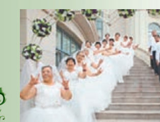
千對老人在青島海灘上演婚紗秀。

來自內地各地的1,000多對金婚、銀婚老人，近日，身著潔白的美麗婚紗、工整的禮服，一起放飛白鴿，在山東青島海灘上演了一場「世界上最多老年人參加的婚紗禮服秀」。