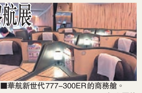
華航新世代777-300ER的商務艙。

根據統計，波音公司銷售的777-300ER客機在全球超過750架，其中華航以東方美學為特色的創新客艙設計，獲得波音公