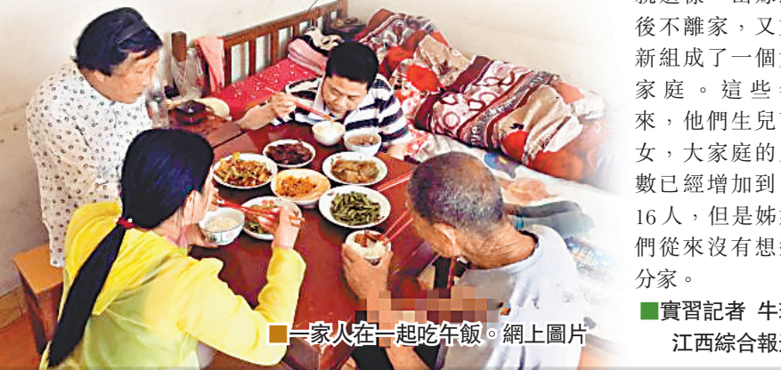
一家人在一起吃晚飯。網上圖片

面具猙獰、服飾奇特、動作凝重，神秘的場景中，舞者附和海澗的唱詞踴躍起舞，動作幾近原始——這就是入選國家級非物質文化遺產名錄的恩施儺戲。土家人希望借助「儺」的神秘力量來表達對祖先的崇拜和對美好未來的祈求。圖為當地民間藝人表演恩施儺戲。