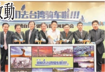
「我們去台灣騎車啦—台灣自行車優質行程」啟動儀式。

台旅會北京辦事處主任楊瑞宗表示，台灣具有建置完善的自行車道及環台自行車路線，是自行車愛好者的騎乘天