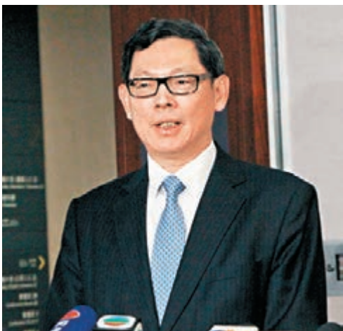
▲路透昨報道，金管局短期內或會完成首宗反洗黑錢調查。圖為金管局總裁陳德霖。

金管局指，根據聯合財富情報組去年收到的可疑交易報告中，有83%是銀行作出的，而舉報宗數亦逐年上升，反映銀行在打擊清洗黑錢的制度及管控制度越趨成熟。