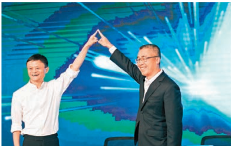
▲阿里巴巴集團執行主席馬雲(左)與上海文廣集團董事長黎瑞剛(右)出席簽約儀式。

港股自4月初踏入大時代，恒指由不足25,000點一度升穿二萬八關口，雖然至今有一定調整，但仍升逾2,500點。不少上市公司股價隨之水漲船高，今年第二季至今本港整體集資額已逾2,180億元，是歷來第三多的一季，僅次於2010年第二季集資王友邦保險上市，以及2005年第三季建設銀行掛牌，有分析認為，隨牛市持續，今後「抽水」的動作會越來越多，次季集資額很有可能「再創高峰」。