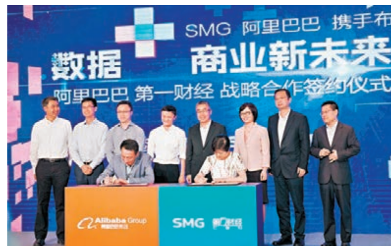
▲阿里巴巴集團與上海文廣集團簽訂戰略協議現場。

國駐上海總領事館於短期內將合作推出「信用簽證」服務，簡化內地旅客到盧森堡旅遊的簽證申請資料準備過程。透過螞蟻金融服務集團旗下芝麻信用的評分系統，新服務將令申請旅遊簽證更簡易快捷，令中國內地旅客出境旅遊更為便利。此前，首個「信用簽證」目的地新加坡，已於5月底在阿里旅行·去啊簽證頻道正式推出相關服務。