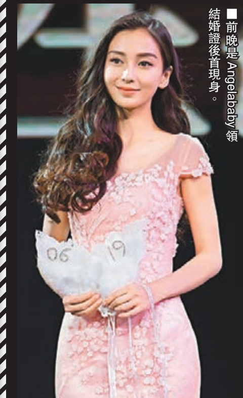
前晚是Angelababy領結婚證後首度現身。

為合作的影片《橫衝直撞好萊塢》使林詣彬對他們有了深入的了解，並期待與他們有更多合作。林詣彬說，他們不只是中國的明星，他們有能力成為世界的明星。