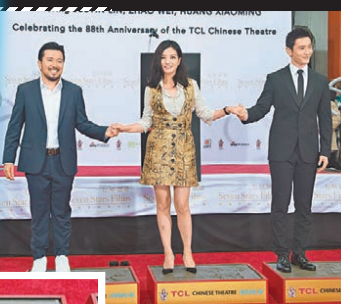
三人又穿着鞋留下腳印。