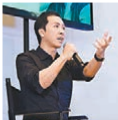
甄子丹認為要拍一部有品質的武打片，真的需要豁出去。

香港文匯報訊 (記者植植) 甄子丹前晚於北京出席活動和現場影迷對話，大談生活和電影，還有健身方式等。談及電影的拍攝，子丹說：「現在拍一部有品質的武打片，真的需要豁出去，不是說不注意安全，我覺得最高水準的藝術需要有一種冒險精神，而且現今拍電影水準越來越高。所以即使我們都有受傷，但最後片子出來應該會是部經典。」談及現在拍攝的電影《葉問3》，子丹稱與自己拍對手的泰臣人很好，雖然外表強悍，但人品非常nice，「泰臣也是我的偶像，我把他的打法運用到電影中」。而拍戲也是感情的一種抒發，這次甄子丹稱把多年的感情放在《葉問3》之中，希望這部電影是最好作品。