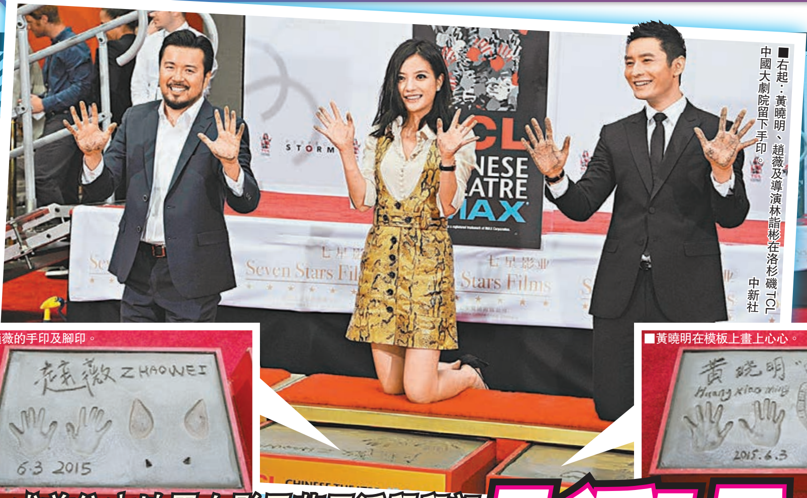
右起：黃曉明、趙薇及導演林詣彬在洛杉磯TCL中國大劇院留下手印。