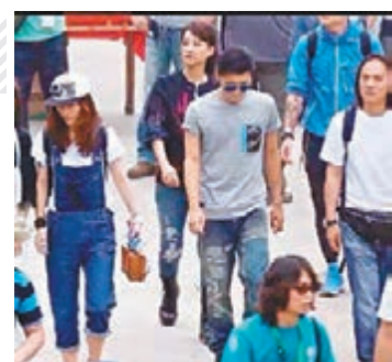
謝霆鋒近日在內地四出奔走拍攝《十二道鋒味》。

上菜工具，藉以配合其飲食節目的風格。而本集《鋒味》內容相當豐富，而霆鋒亦會在水果市場賣椰子和一嚐包粽子的滋味。除了飲食環節之外，節目還大打溫情牌，安排霆鋒幫當地老人打水及談心。節目組知悉當地群眾會很熱情，故還特別安排了彪形大漢擔任保安，認真厲害！