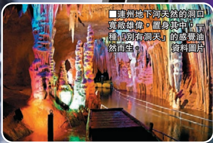
■連州地下河天然的洞口寬敞雄偉，置身其中，一種「別有洞天」的感覺油然而生。資料圖片