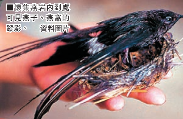
■懷集燕岩內到處可見燕子、燕窩的蹤影。資料圖片