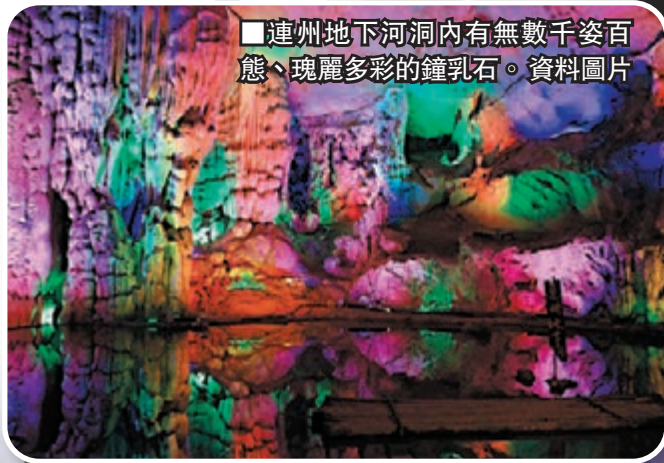
■連州地下河洞內有無數千姿百態、瑰麗多彩的鐘乳石。