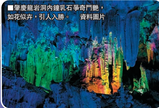
■肇慶龍岩洞內鐘乳石爭奇鬥艷，如花似卉，引人入勝。