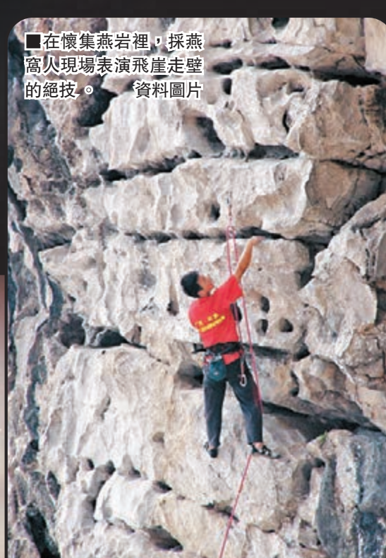
■在懷集燕岩裡，採燕窩人現場表演飛崖走壁的絕技。資料圖片