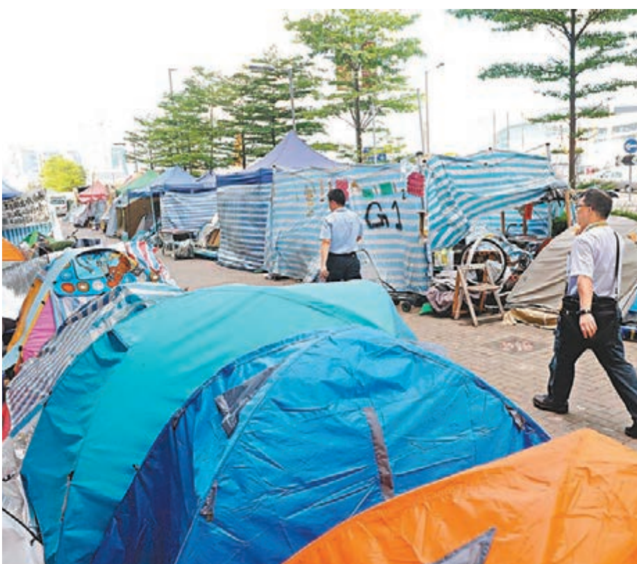
大批示威者仍然把帳篷、搭建物及其他物件「非法霸佔」政府總部及立法會綜合大樓外添美道及夏慤道的行人路，構成治安及環境衛生問題。

事實上，自去年違法「佔中」結束後，大批「佔領」者在政府總部及立法會大樓外，長期搭建帳篷及木屋試圖「續佔」，衍生治安及衛生問題。近日，帳篷及木屋等數目更是不尋常地持續遞增。「民陣」日前更號召激進組織在立法會表決當日包圍立法會，有「佔領」者亦即晚在大樓外利用木箱的廢木搭建木屋，勢要將行動無限「升級」。