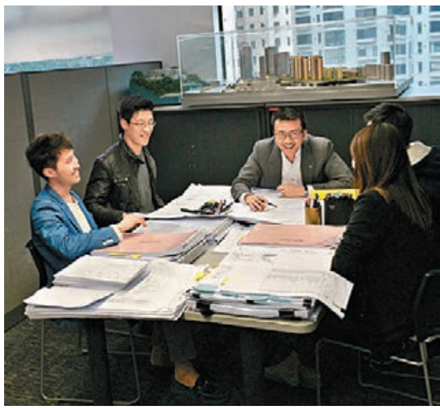
■設計建造複雜項目時，與項目團隊及BIM團隊的協作尤為重要。