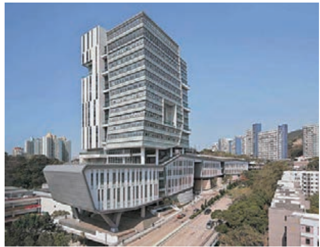
■城大項目以可持續發展為方向，成功平衡周遭生態環境，順利贏得環保設計先鋒大獎。

事務所在TOD（以公交為導向的發展）項目方面擁有多年的經驗，並力求將其在香港的高密度TOD發展經驗帶回內地，幫助內地城市興建新城市綜合體，為國家未來發展盡一分力。天晉便是這樣的一個項目，它是建於上海閘行區莘莊地鐵站上蓋的超大型綜合發展項目，旨在創造出一個良好全面的社區網絡，創建一個綜合發展的小型城市，住宅、服務式公寓、酒店、辦公室、零售、公共空間以至大型交通樞紐一應俱全，建築面積達405,000平方米。