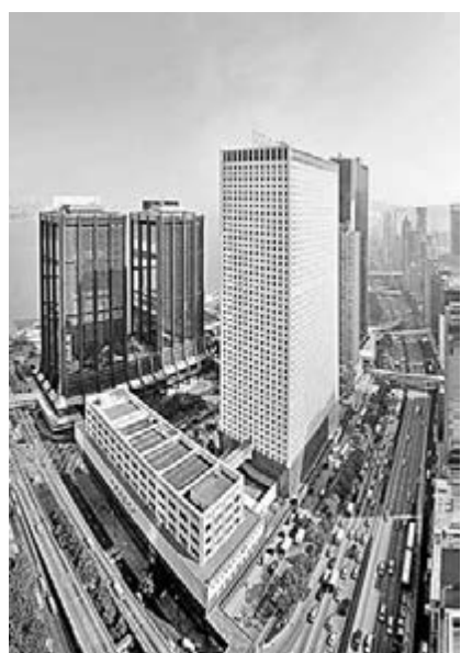
■環保設計先鋒優異獎得主華潤大廈翻新前後對比。