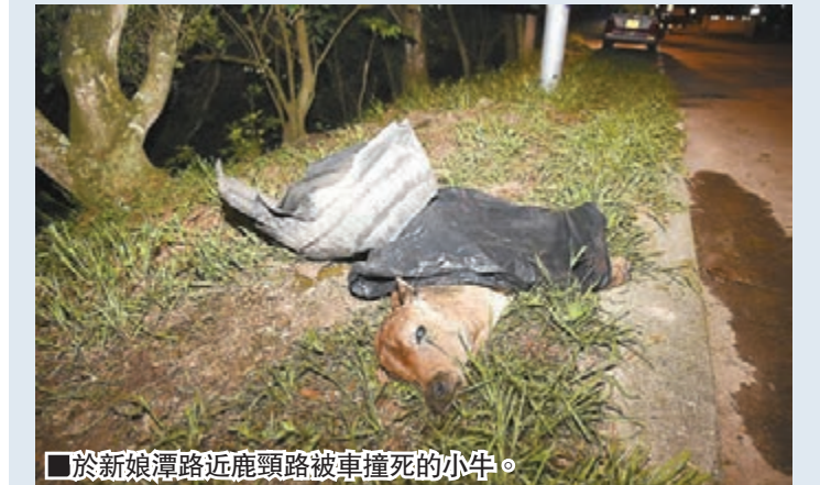
於新娘潭路近鹿頸路被車撞死的小牛。

香港文匯報訊(記者 杜法祖)新界鹿頸新娘潭路,昨日凌晨有兩隻小牛疑橫過馬路時被車連環撞倒,導致一死一傷,一群約20多隻同伴的牛群在旁徘徊不去,被巡邏警車發現,警員並在現場附近檢獲一個貨車泥擋,懷疑貨車撞倒兩隻流浪小牛後不顧而去,其中受傷小牛事後由愛護動物協會人員帶走,最終因傷接受「安樂死」。現場為沙頭角新娘潭路近鹿頸路,昨日凌晨1時許,有警車巡邏經過,發現兩隻小牛倒臥路邊,其中一隻已死亡,另一隻亦受傷臥地不起。警員在現場附近發現一個屬於中型貨車的泥擋,調查後相信有貨車撞倒兩隻小牛後不顧而去,警員調查期間,發現附近有一群為數約20多隻的流浪牛,為同伴之死在附近徘徊不去。