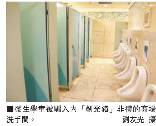
發生學童被騙入內「剝光豬」非禮的商場洗手間。

香港文匯報訊(記者 杜法祖)紅磡又發生色魔冒警非禮男童案。一名14歲男童前日行經紅磡道及鶴園街交界時,被一名自稱警察男子要求搜身,將他帶往海逸道一商場洗手間內非禮。男童事後返家將事件告知母親報警。警方暫列「非禮」及「冒警」處理,正追緝在逃色魔歸案。今次是不足3個月區內第二宗同類事件。前日的冒警色魔為一名年約25歲至35歲中國籍男子,操本地話,身高約1.7米,中等身材,蓄短黑髮,穿白色襯衣、短褲及運動鞋,攜有一個綠色袋。現場消息稱,受害男童前日事發前因橫過馬路,被冒警上前的在逃色魔指其胡亂過馬路,但男童心存懷疑,要求對方出示委任證,唯對方未有理會,更進一步稱懷疑男童身上有毒品,於是將男童帶到廁所脫光身上所有衣服搜查,其間非禮男童,色魔得手後逃去無蹤。男童其後回家將事件告知母親報警。