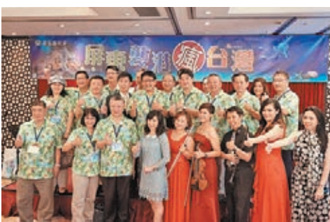
屏東縣長率團來港行銷。

此行是屏東行銷團繼日本大阪農產拓銷後的第二站，潘孟安表示：「兩岸四地關係近年持續急進改善和發展，人員旅客往來頻繁，香港早已躍升為台灣水果外銷的第二大市場。現時，香港愈來愈多自由行的