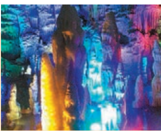
瑰麗奇幻的泰山地下大裂谷

愈往裡走，愈覺視野開闊，真是「別有洞天」。大量的石花、石柱、石筍、石幔、石瀑遍佈，在斑斕的燈光中彷彿置身奇幻世界：有一枝獨秀的「麻姑獻壽」；亦有成群結隊的「周遊列國」；更有氣勢恢宏、自成一景的地下龍宮。最寬敞高大的地下大廳東海龍宮足足有40米高。無需託於神話傳說，亦能真切感受到大自然給予此處的偏愛。高聳的石瀑珠流玉濺，惹得遊人駐足嬉戲；「布質」的石幔似能隨風飄動，讓人應接不暇；還有成群的「珊瑚礁」點綴其間，美不勝收。其實無需關注這些鐘乳