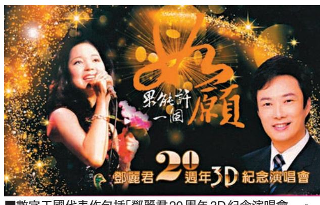
數字王國代表作包括「鄧麗君20週年3D紀念演唱會」。

香港文匯報訊(記者 張易)數字王國(0547)昨日股價在大成交下洗倉式下跌，低開8%後，半日急瀉50%，午後曾進一步跌近61%。公司管理層召開緊急電話會議稱，相信股價大跌與投資者獲利回吐有關，並強調管理層未有被抓。該股收市稍為喘定，收跌41.39%報1.26元，全日成交30.01億元，單日市值蒸發87.51億元。