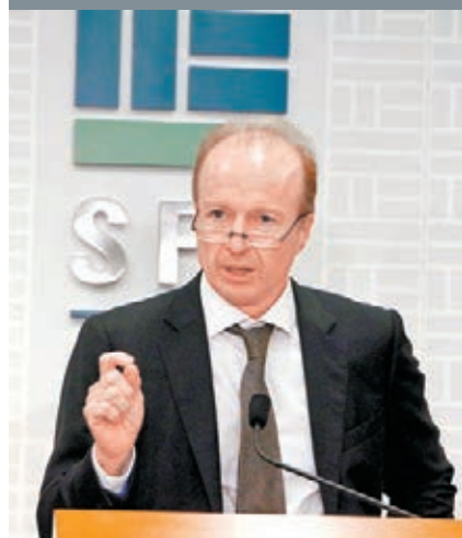
歐達禮認為，加強監管可促進整個金融體系安全可靠。

香港文匯報訊(記者 周紹基)證監會行政總裁歐達禮昨表示，自金融危機發生後，市場對監管機構存在誤解，包括認為監管工作會阻礙市場流動性及投資活動等，令他們的監管成本增加。但他反駁指，目前的監管並沒限制着環球金融行業流動性及創造力，反而可有助恢復市場信心，以及促進整個金融體系安全可靠，保障投資者及重建市場的信心。