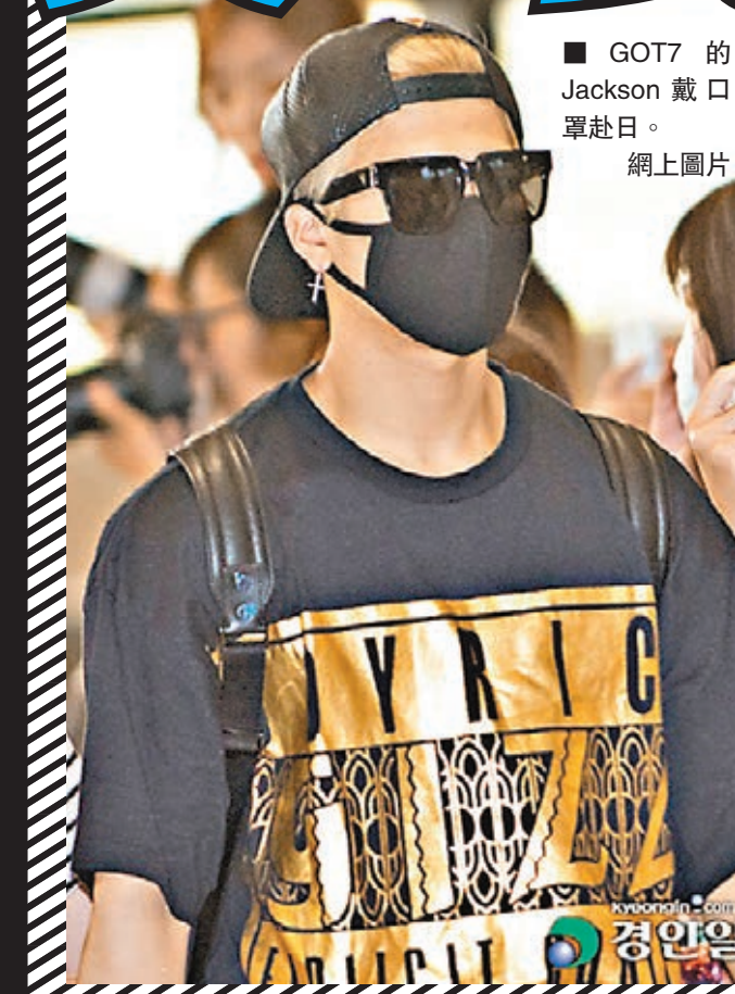
■GOT7的Jackson戴口罩赴日。

身為品牌全球代言人的全智賢,身穿大會為她度身訂造的藍色Deep V連身裙出場,雍容華貴,一舉一動盡顯女神氣質。親民的她笑臉迎人,不時與粉絲作近距離接觸,更與他們握手,心情相當不俗。但環顧四周,除了有過千粉絲在場迎接女神,和過百保安維持秩序之外,偏偏就不見口罩的蹤影,現場無人戴口罩,大會亦沒有安排特別的防疫措施。據悉,全智賢的代言酬金達千萬港幣!難怪在「新沙士」的威脅下,全智賢如期出席活動,大家又不忘爭先一睹全智賢的風采,與女神近距離見面!