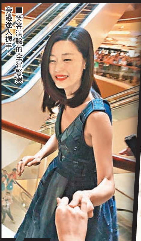
■笑容滿臉的全智賢與旁邊途人握手。