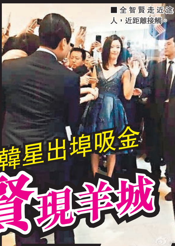
■全智賢走近途人,近距離接觸。

香港文匯報訊(實習記者 梁文玲)韓國雖罩在「新沙士」中東呼吸綜合症(MERS)的陰霾之下,惟不少韓星並未受疫情影響,依舊心情靚靚頻頻出埠吸金!繼早前韓星李鍾碩、宋承憲等人相繼襲港及到內地出席活動之外,憑韓劇《來自星星的你》而再度紅爆亞洲的全智賢,昨日就在廣州出席品牌活動。全智賢更一邊行一邊跟粉絲及路人握手,近距離接觸,認真nice!