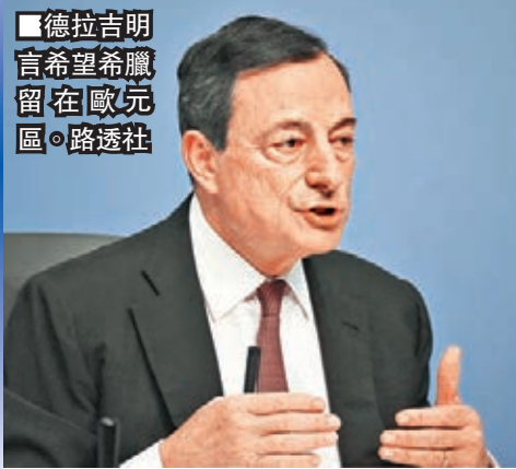
德拉吉明言希望希臘留在歐元區。

歐洲央行昨日議息，一如市場預期維持當前利率不變，同時把歐元區今年通脹預測從零通脹上調至0.3%，反映通脹風險下降，市場猜測歐央行可能因此縮小量化寬鬆(QE)規模，不過行長德拉吉強調會繼續全面推行QE。德拉吉又談到希臘債務問題，明言希望希臘留在歐元區。法國總統奧朗德昨日則聲稱，各方最快「幾小時內」有望就希臘問題達成協議。