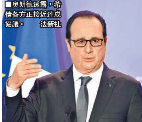
奧朗德透露，希臘各方正接近達成協議。