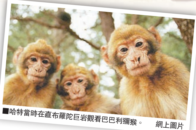
■哈特當時在直布羅陀巨岩觀看巴巴利獼猴。