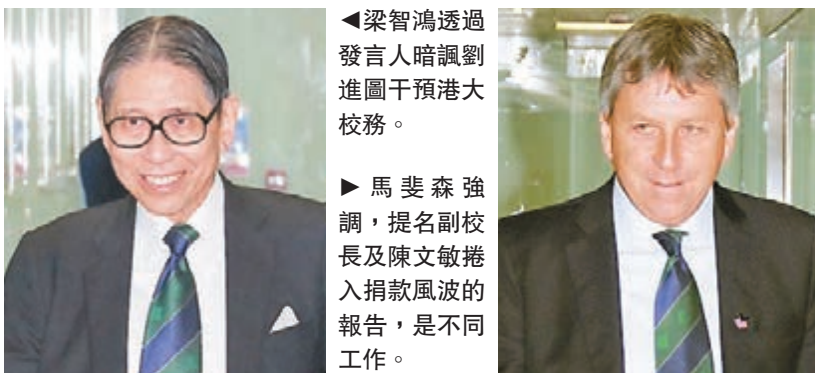
梁智鴻透過發言人暗諷劉進圖干預港大校務。