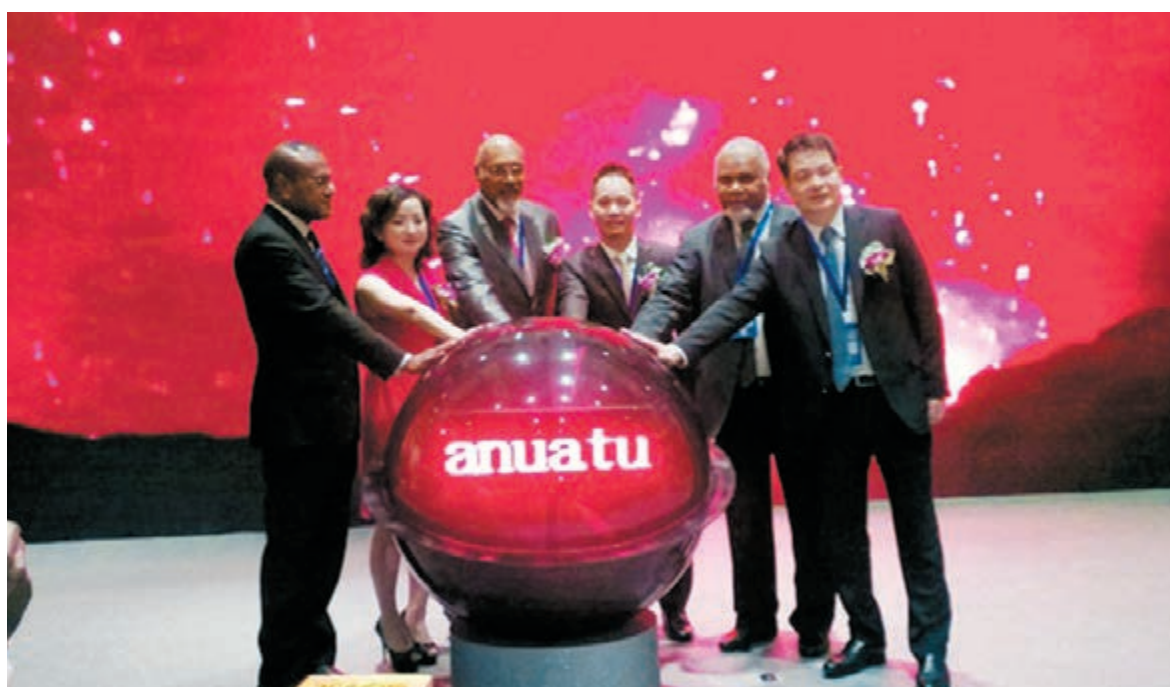
瓦努阿圖吸納全球投資移民的計劃日前正式啓動。

瓦努阿圖位於南太平洋島嶼洲以東，新西蘭以北，斐濟的西側，是一個由83個小島構成的島嶼國家。瓦努阿圖的經濟屬於小規模農業經濟，其支柱產業主要集中在農業、漁業、離岸金融以及旅遊業。