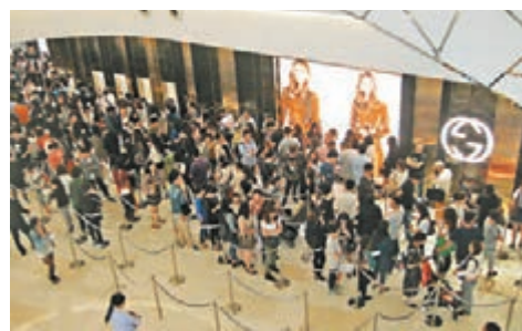
上海—古馳(GUCCI)店5月26日出現排隊人龍。

精品業者想抓中國旅客的消費財，另一方面也不放棄中國市場，部分業者已開始調整定價，期望拉回中國消費者於當地的購物意願，其中香奈兒率先開槍，破天荒下調中國定價且調高歐洲定價各20%，Burberry也於日前宣佈