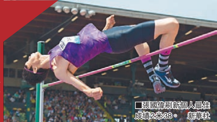
■張國偉刷新個人最佳成績2米33。

蘇炳添以9.99秒創造中國選手首次跑進10秒大關歷史的同時，男子跳高新星張國偉上周六在國際田聯鑽石聯賽尤金站以2米38的個人最好成績，獲得亞軍。