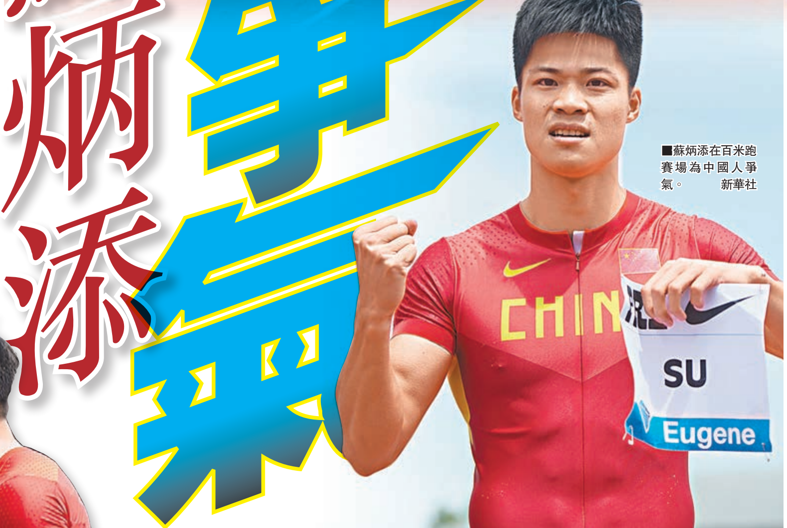
■蘇炳添在百米跑賽場為中國人爭氣。