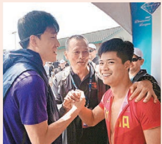
■蘇炳添(右)賽後接受劉翔祝賀。

蘇炳添感謝劉翔賽前給自己的鼓勵：「這次賽前，翔哥(劉翔)也給我很大鼓勵，要我注意起跑節奏，進入途中跑後也要把握節奏，不要亂。今天比賽我完全是跑自己的，沒有看任何人，從起跑衝刺都是非常專注地在跑。」