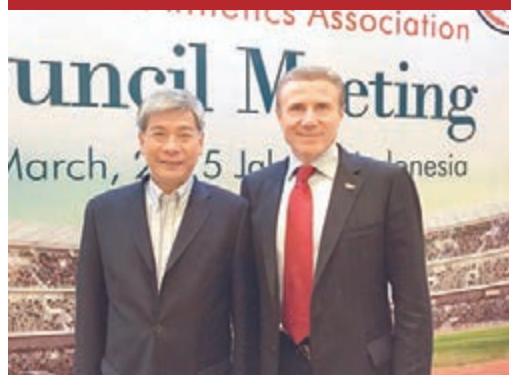
■布卡(右)指不應以奧運獎牌作為衡量中國田徑的唯一標準。

蘇炳添在國際田聯鑽石聯賽尤金站跑出9秒99的成績，打破全國紀錄的同時，也向世界證明中國人在衝擊人類速度極限的道路上，同樣有能力跨越10秒的藩籬。國際田聯副主席、烏克蘭撐杆跳高名宿布卡接受新華社專訪時也表示，中國田徑足夠強大，中國在世界體育舞台上所扮演的角色也越發重要。