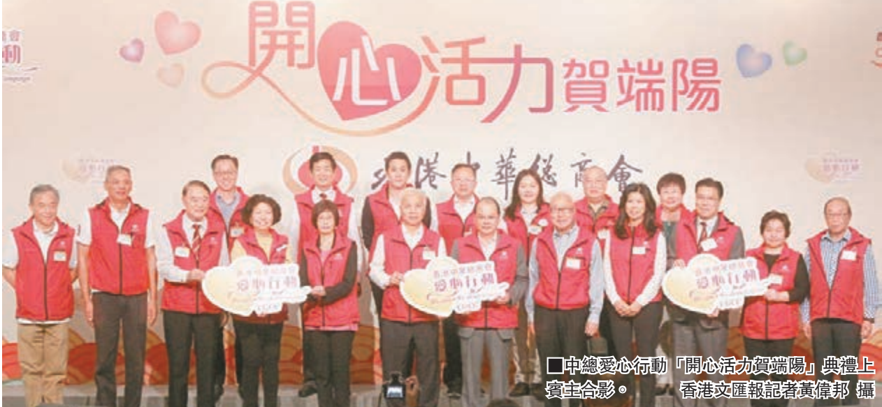
中總愛心行動「開心活力賀端陽」典禮上賓主合影。

香港文匯報訊(記者 邵萬寬)香港中華總商會「愛心行動」昨假香港會議展覽中心舉辦「開心活力賀端陽」活動。勞工及福利局局長張建宗,香港中華總商會會長楊釗、副會長莊學山,勞工及福利局常任秘書長譚贛蘭、前扶貧委員會社會參與專責小組副主席紀文鳳、香港會議展覽中心董事總經理梅李玉霞等蒞臨主禮。賓主與近300名精神復康人士享用豐富自助午餐、欣賞歌唱及魔術表演。大會更向大家派發應節粽子和愛心福袋,為迎接端午佳節預先送上祝福。