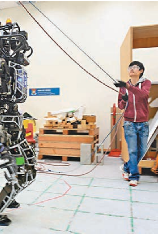
「主題研究計劃」的新增主題擬包括大數據、影像可視化和機械人、城市基礎建設以及電子學習等四大項目。圖為本地大學研究人員早前的先進機械人科研。

「像Robotics(機械人)方面,現時社會其實已踏入了machine age(機器時代),很多常規的工作都可以自動化去做,像無人駕駛車就是其中之一,這範疇對未來的工業轉型發展很重要。」此外,他亦指出,大數據有助於數據中挖掘智慧,應用範疇很廣,在交通、醫療、基礎設施等方面都有作用,對建設綠色智慧城市很重要,「基建更是香港的強項之一,而電子學習亦是國際大趨勢。」