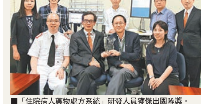
「住院病人藥物處方系統」研發人員獲傑出團隊獎。

香港文匯報訊(記者 袁楚雙)醫生向病人開方，藥物送到病人手旁。這個看似簡單的步驟，中間原來牽涉多項工作，經醫生、護士、藥房、不同的醫院人手核對和抄寫藥單，才將一顆小小藥丸送到病人口中。醫管局斥資1.72億元為全港多間大型急症全科醫院更新「住院病人藥物處方系統」，新系統將病人的用藥情況及藥物資料全部電子化，省卻人手抄寫之行政工作，亦有效減低錯誤處方藥物的機會。研發系統的人員獲頒發本年度醫管局傑出團隊獎。傳統藥物處方的流程是先由醫生開藥方，交由護士