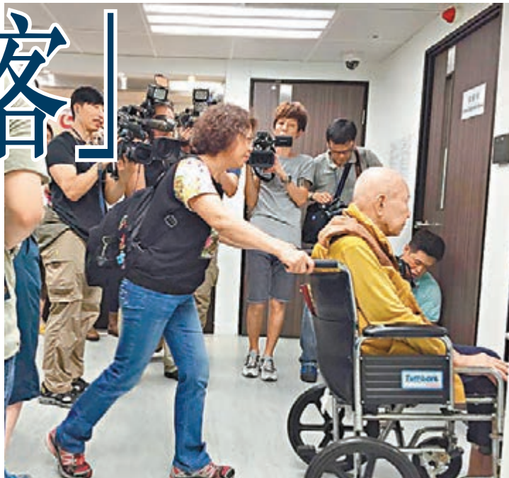
有家屬帶同輪椅入的親人到社署求助。