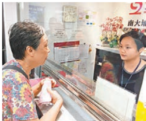
昨日陸續有院友家屬到社署服務站求助。