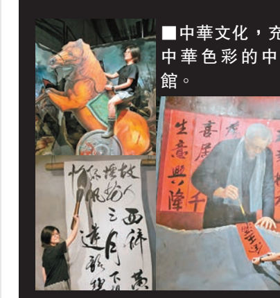
■中華文化，充滿濃厚中華色彩的中華文化館。