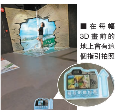
■在每幅 3D 畫前的地上會有這個指引拍照