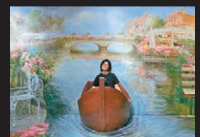
■法式風情，以法國美麗的風景為主題，讓大家在充滿懷舊和現代風情的 3D 畫內留影。