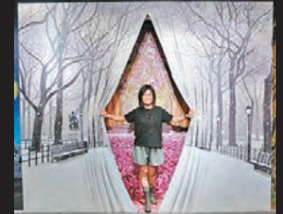
■浪漫戀人，以各種令人陶醉的浪漫畫面為主題，大家可在這些浪漫的場景下與愛侶留影。