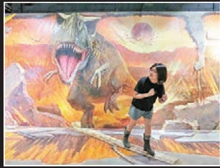
■3D 侏羅紀，加入模擬恐龍聲效，令大家有如置身於侏羅紀中，與各種栩栩如生的恐龍合照。