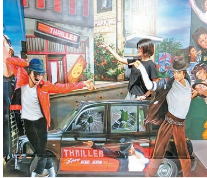
■亞洲首個 MJ 3D 展，讓大家與偶像合照之餘，更可進入 MJ 的各個經典場面，與他同台演出，在舞台上拍出如幻似真的 3D 相片。