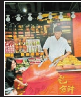
■澳門 3D 之旅，利用澳門著名的特色景點和元素，3D 化地呈現在大家眼前。如站在澳門旅遊塔的塔頂等。