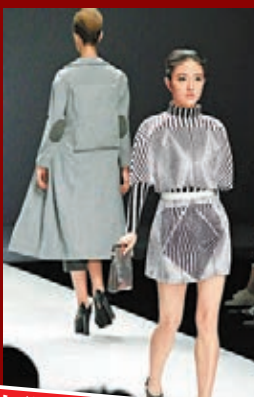
福州大學廈門工藝美術學院