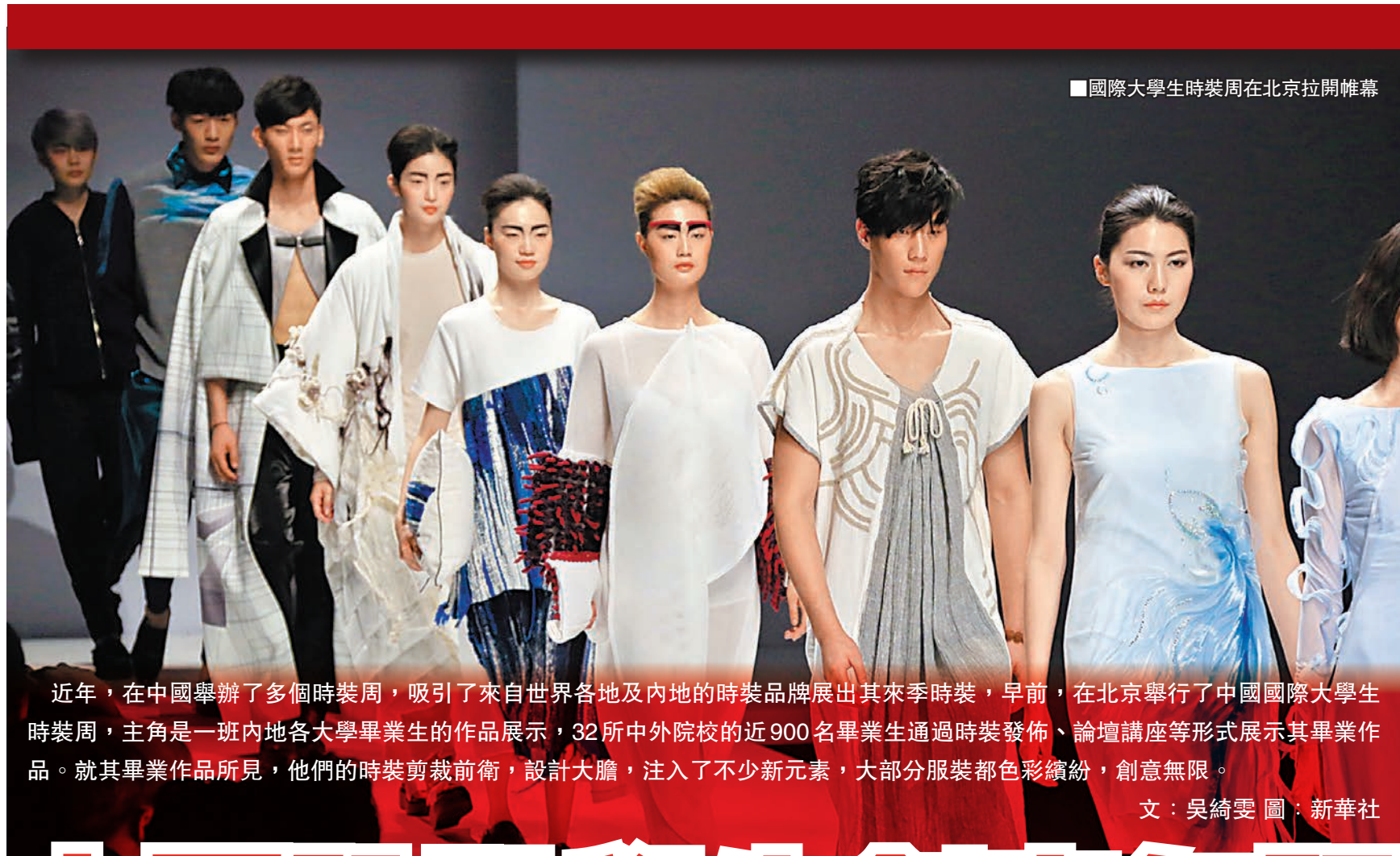
■國際大學生時裝周在北京拉開帷幕

近年，在中國舉辦了多個時裝周，吸引了來自世界各地及內地的時裝品牌展出其來季時裝，早前，在北京舉行了中國國際大學生時裝周，主角是一班內地各大學畢業生的作品展示，32所中外院校的近900名畢業生通過時裝發佈、論壇講座等形式展示其畢業作品。就其畢業作品所見，他們的時裝剪裁前衛，設計大膽，注入了不少新元素，大部分服裝都色彩繽紛，創意無限。