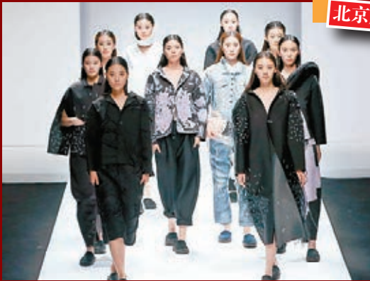
北京服裝學院服裝藝術與工程學院