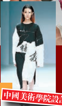
中國美術學院設計藝術學院