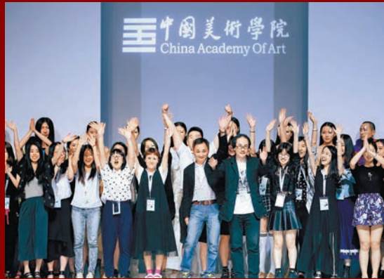
中國美術學院 China Academy Of Art