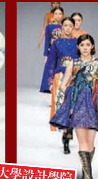
湖北江漢大學設計學院