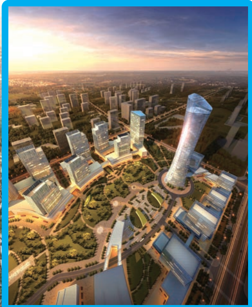
■ 湘江新區國際醫療健康城位於梅溪湖國際新城（二期），圖為建設示意圖。