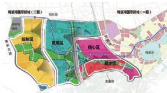
■ 湘江新區國際醫療健康城發展規劃圖。

湘江新區國際醫療健康城自今年啟動前期工作以來，各項工作快速推進。據梅溪湖投資(長沙)有限公司負責人介紹，湘江新區國際醫療健康城將採取市場化運作，以「政府引導、市場運作」為原則，整合「土地、政策、資本、技術、創新」五大要素，通過市場化運作，充分利用多種合作及融資方式，如整體合作開發、定制BT、PPP、合資基金等，進行項目的運作和管理。項目還將設立醫療健康產業扶持基金，為項目的快速發展提供完整的金融服務及資金保證。