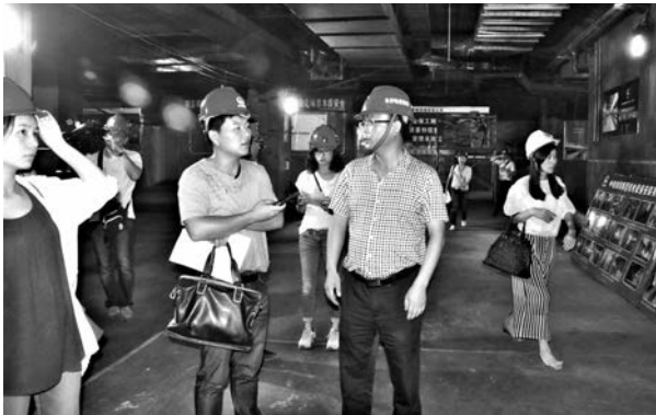
■長沙地鐵二號線西延線建設進入掃尾階段，2016年上半年將通車試運營。圖為工程負責人向記者介紹建設情況。

在32平方公里土地上，梅溪湖國際新城落子佈局。自2009年3月啟動拆遷，已完成一、二級土地開發總投入超過550億，並全面引入了優質文化、教育、醫療、商業、科技配套項目，長沙新城中心形象已初步