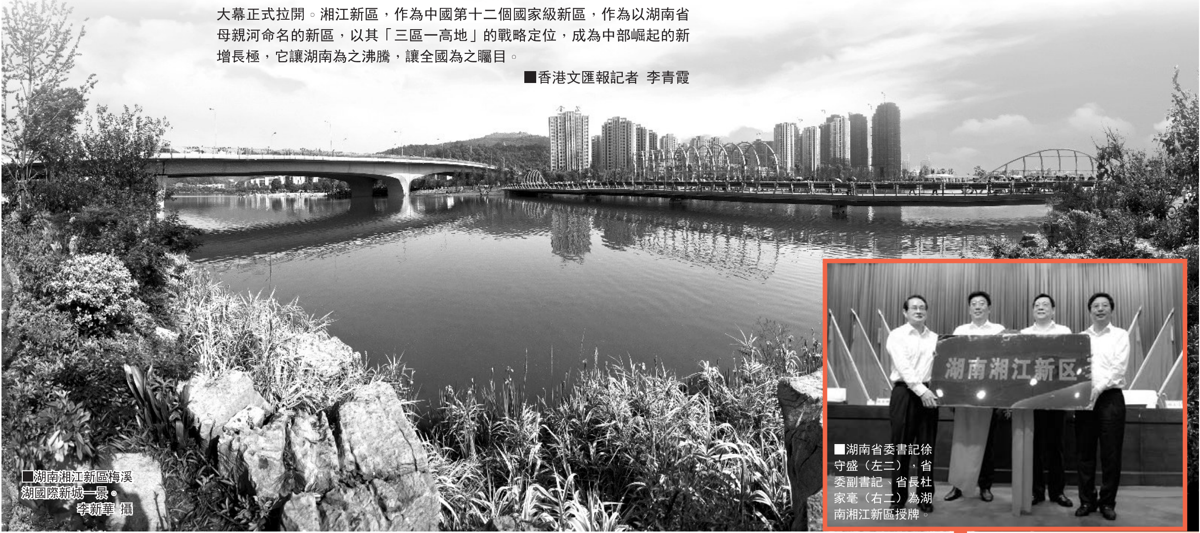
■湖南湘江新區梅溪湖國際新城一景。