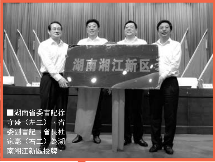
■湖南省委書記徐守盛（左二），省委副書記、省長杜家毫（右二）為湖南湘江新區授牌。