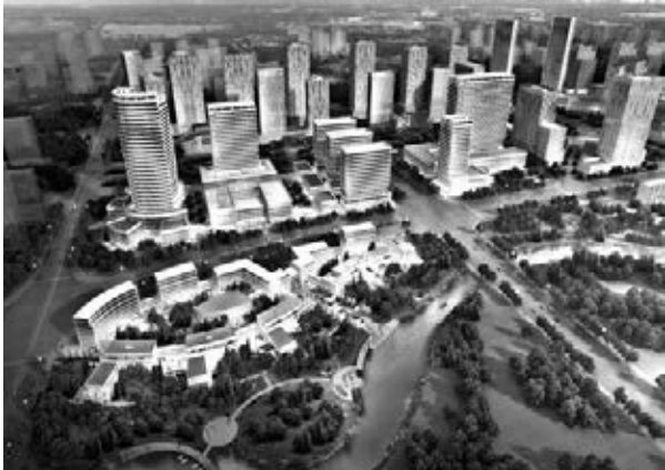
■湘江新區國際醫療健康城醫療服務區透視圖。

夕陽斜暉，湖光倒映，柳低垂，人愜意，一派新城景象，在美麗的梅溪湖展開。作為湘江新區新城中心，梅溪湖國際新城用「創新」、「新意」打造一方宜居宜業宜遊的「新作」。