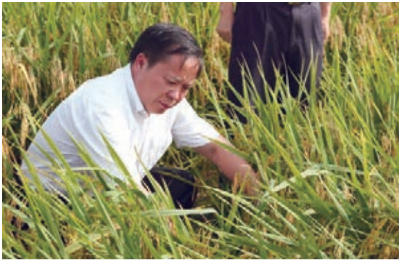
■湖南省農委主任劉宗林在雙峰察看優質稻長勢。

2014年湖南省糧食總產再次躍上600億斤台階，以佔全國不到3%的耕地生產了佔全國5%的糧食；農林牧漁業總產值增長4.7%，增加值增長4.6%，是近5年增長最多的一年；農村居民人均可支配收入達10060元，增長11.4%，高於城鎮居民收入增長2.3個百分點，增幅連續4年超過城鎮居民收入。