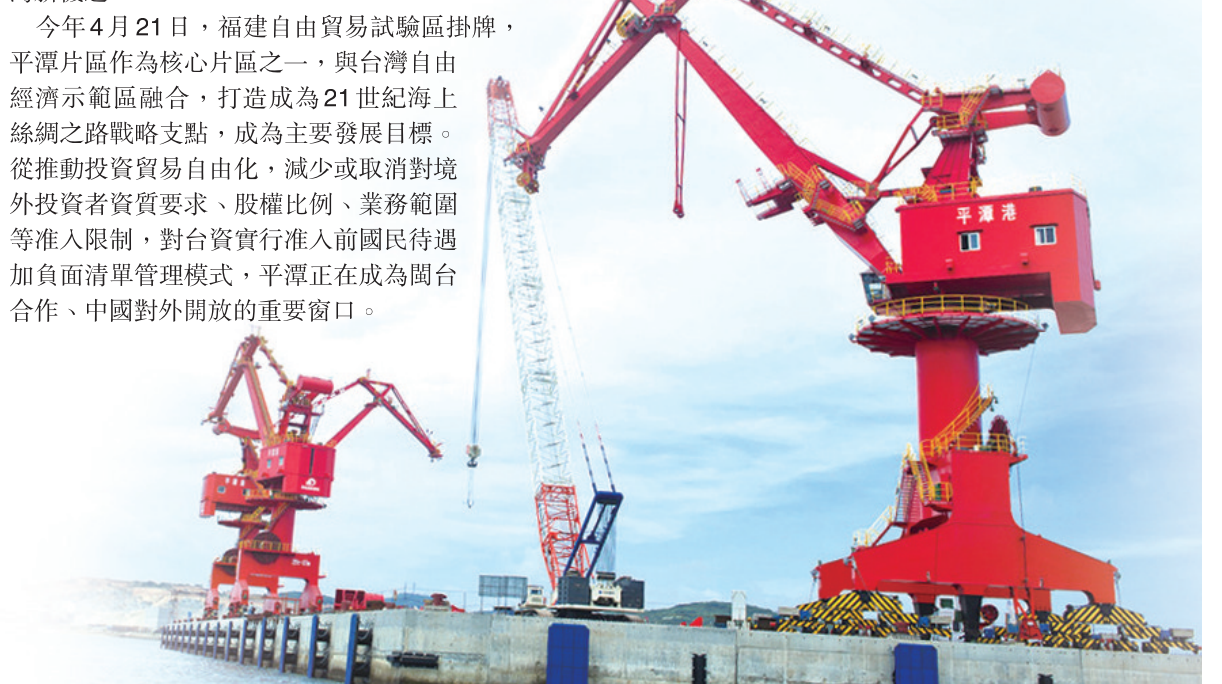
金井口岸作業區2-3#泊位已投入使用。

今年4月台灣最大民間企業組織「三三會」會長江丙坤率50位台灣企業家訪問，考察福建自貿區與「一帶一路」視野下的台海融合商機。三三會副會長、統一企業集團董事林蒼生形容台灣經平潭接上「絲路」，是「在最美的時候，產生最高的價值」。他說，台灣可為大陸減低成本、引進技術，推動中國產品與世界對接。而平潭將作為其中承接台灣製造業轉移的關鍵一環，多重利好政策疊加，釋放出更多能量。