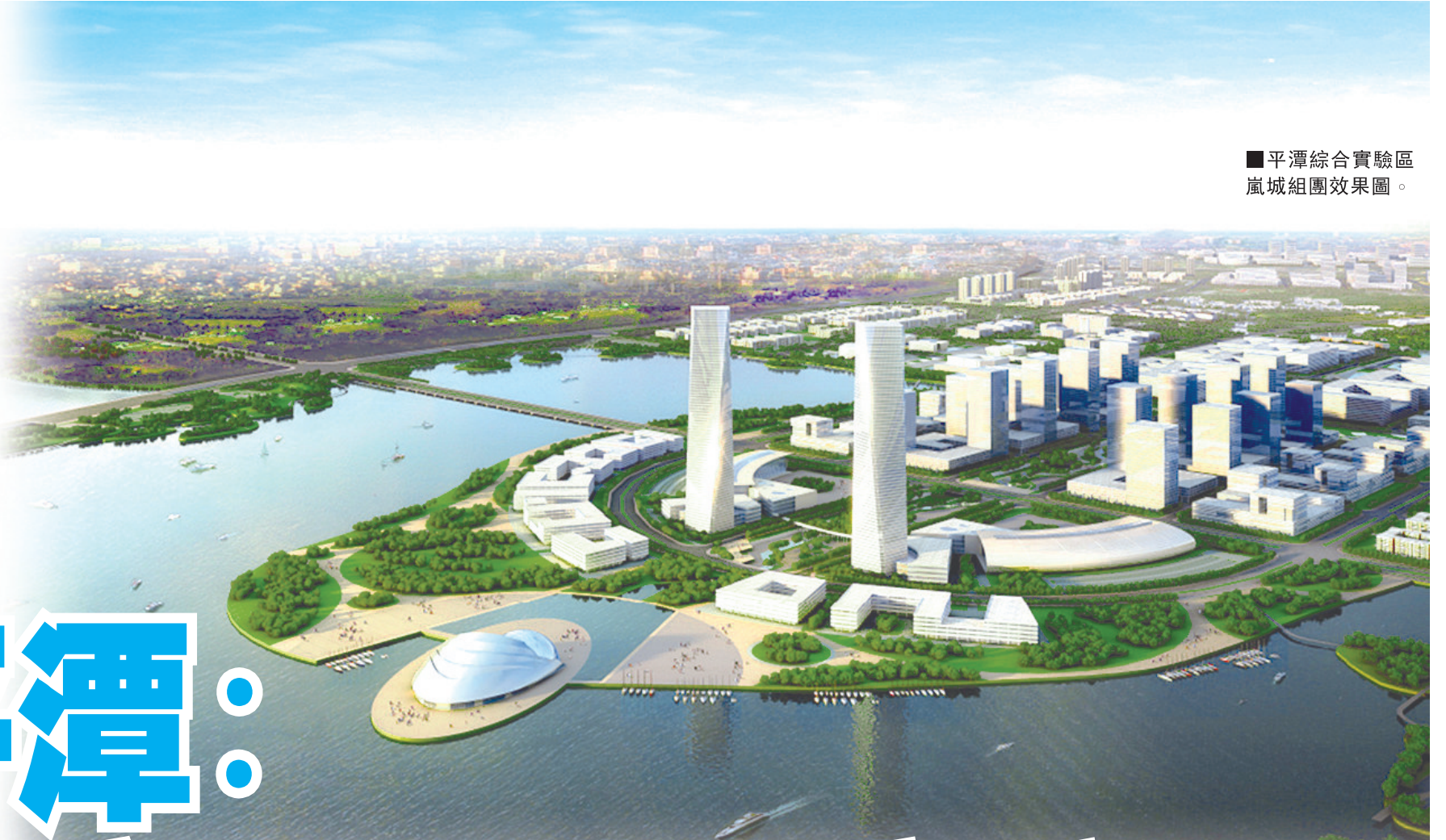
平潭綜合實驗區嵐城組團效果圖。