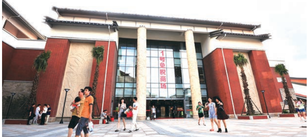
平潭台灣商品免稅市場。