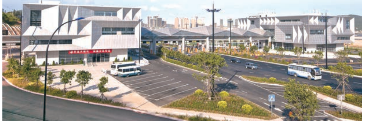
平潭海關二線卡口。

去年7月，平潭實驗區正式實現全島封關運作，實施「一線放寬、二線管住、內貨分離、分類管理」的特殊通關模式，國家賦予平潭的有關免稅、保稅、退稅及「選擇性徵稅」通關管理和其他稅收優惠政策全面落地，成為大陸面積最大、政策最優的特殊監管區。 平潭海關負責人介紹，平潭銷往內地的貨物需徵收進口關稅，但可以選擇稅額較低的稅種徵收，即為「選擇性徵稅」。而這被認為是平潭高含金量的又一條稅收政策優惠。 特殊政策和監管模式，讓平潭真正成為對台「新特區」。區內企業配套越來越齊全、方便，企業物流成本和產業運作成本變得更低，吸引了眾多企業入駐，