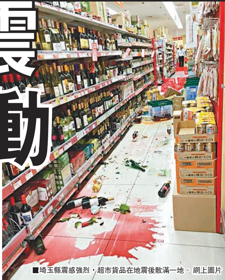
■埼玉縣震感強烈，超市貨品在地震後散滿一地。

日本近期接連發生地質活動，繼本月25日關東地區地震和早前鹿兒島縣火山爆發後，小笠原群島西部海域昨晚發生黎克特制8.5級強烈地震，關東地區廣泛範圍震感強烈。據報東京樓宇高層感到頗強烈晃動，至少持續了1分鐘，路邊車輛的警報器紛紛響起。由於震源較深，氣象廳表示沒海嘯威脅，東京消防廳稱已知地震最少造成5人受傷。受地震影響，東京羽田機場跑道短暫關閉，東京地鐵亦曾全線停駛，來往東京及大阪的新幹線亦一度停止服務。