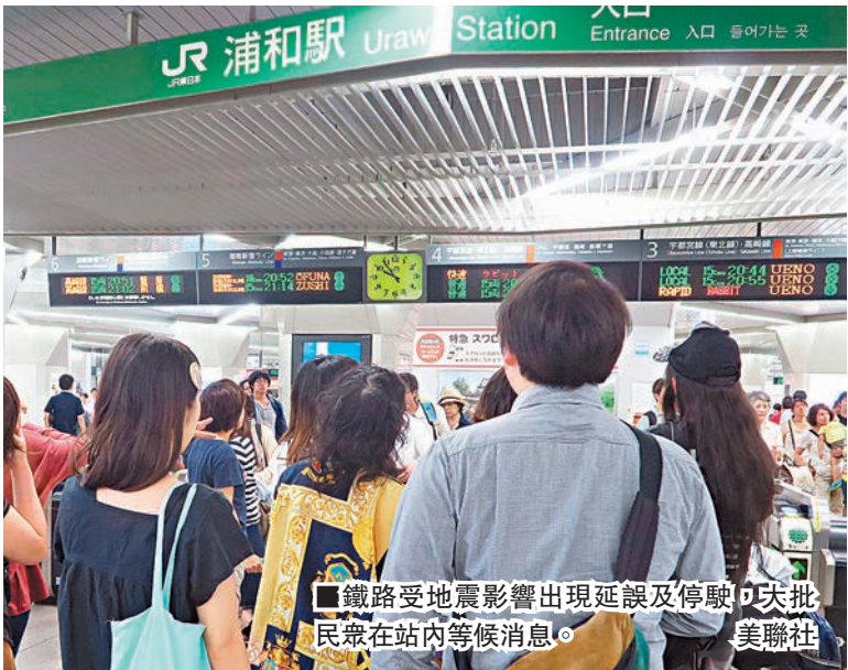
■鐵路受地震影響出現延誤及停駛，大批民眾在站內等候消息。