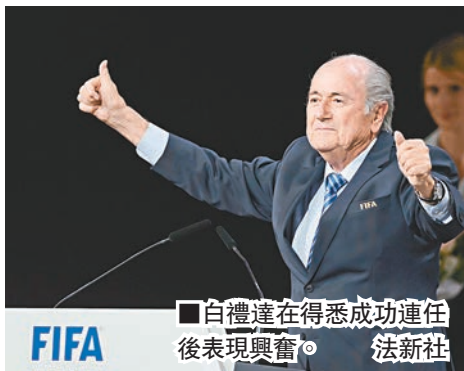
■白禮達在得悉成功連任後表現興奮。

英格蘭足總主席戴克狠批FIFA貪腐嚴重得不能接受，認為白禮達「過得了初一，過不了十五」，遲早要被迫下台。對於柏