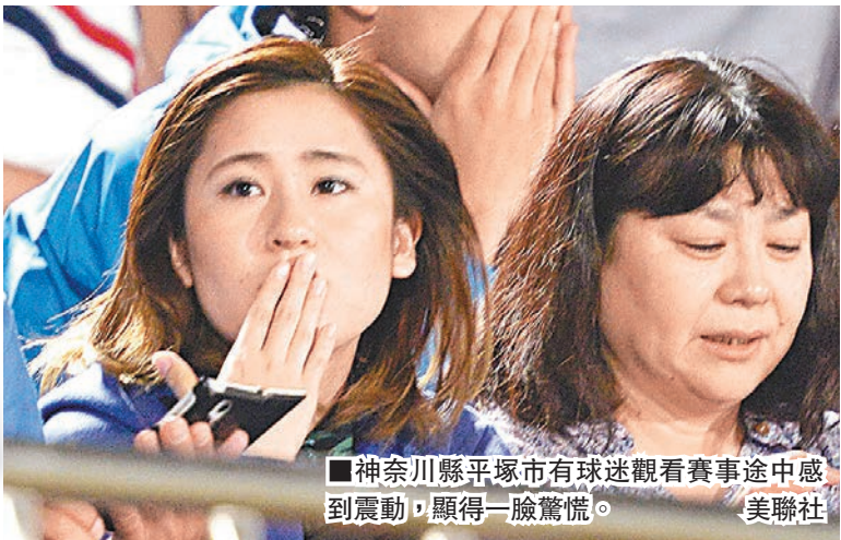
■神奈川縣平塚市有球迷觀看賽事途中感到震動，顯得一臉驚慌。