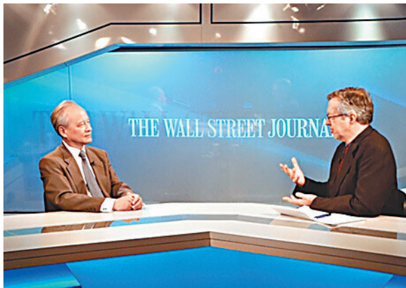
■崔天凱（左）就南海局勢接受《華爾街日報》外事主編霍瓦特專訪。

勢就會被他們當作推進軍事部署、組建冷戰式的軍事同盟、部署新型反導系統的藉口。如果這確實是一些人的真實意圖，那麼其他事情就順理成章了，其中的邏輯也顯而易見。