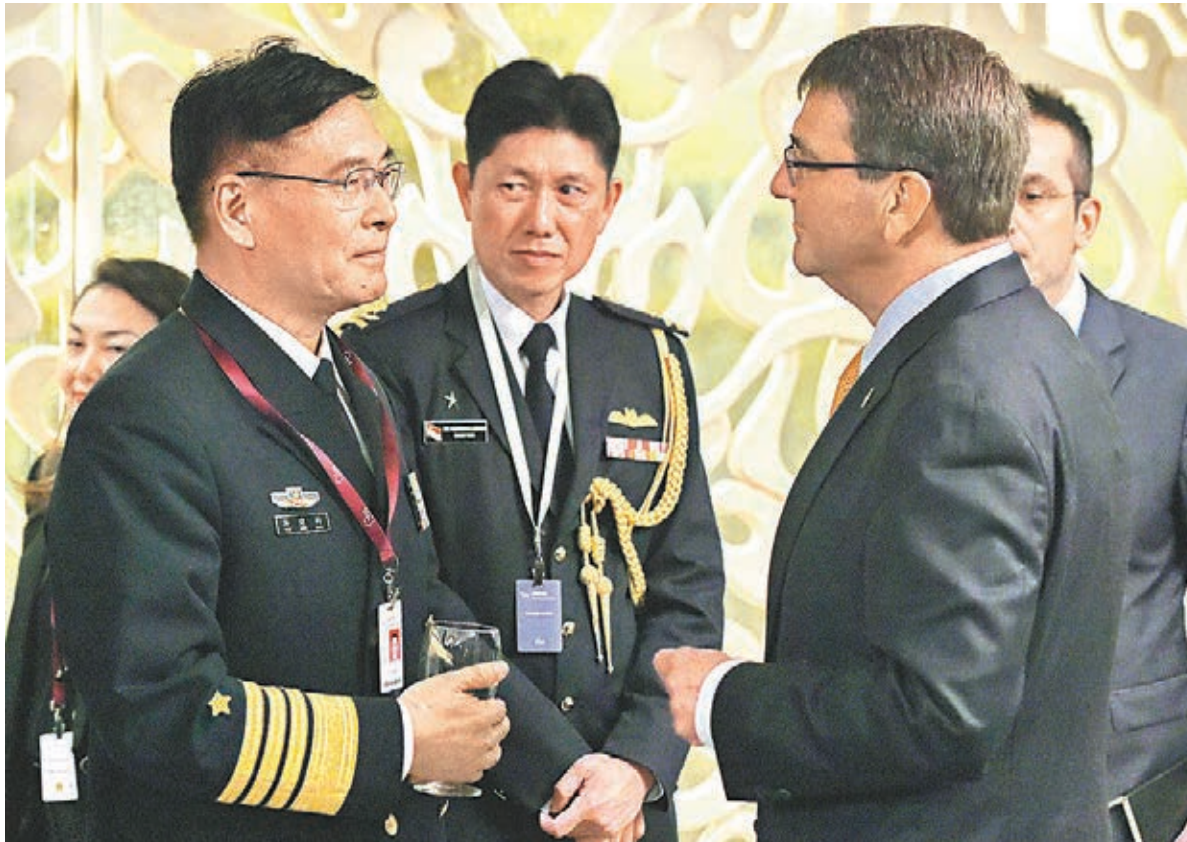
■出席香格里拉對話會的解放軍副總參謀長孫建國（左）與美國國防部長卡特交談。

針對卡特點名批評中國在南海填海造地，增加國際衝突風險，有關做法亦不會擴大領土主權範圍。出席會議的中國軍事科學院中美防務關係研究中心副主任趙小卓大校，即場反駁卡特的言論無理據及沒有建設性，強調中國在南海的活動合法、合情、合理。