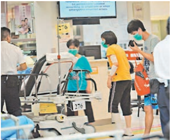
■康潤樓淋腐液案中男戶主(臥床)、其妻及女兒一同送院救治。

香港文匯報訊（記者 鄭福強）慈雲山慈康邨一單位昨晚發生潑淋腐蝕性液體傷人案，一名以口罩蒙面青年登門，突向戶主一家3口潑淋懷疑通渠水，3人頓被灼傷身體多處，男戶主首當其衝被淋中頭部及面部，傷勢嚴重，警方正調查案件動機，並通緝該名涉案青年歸案。