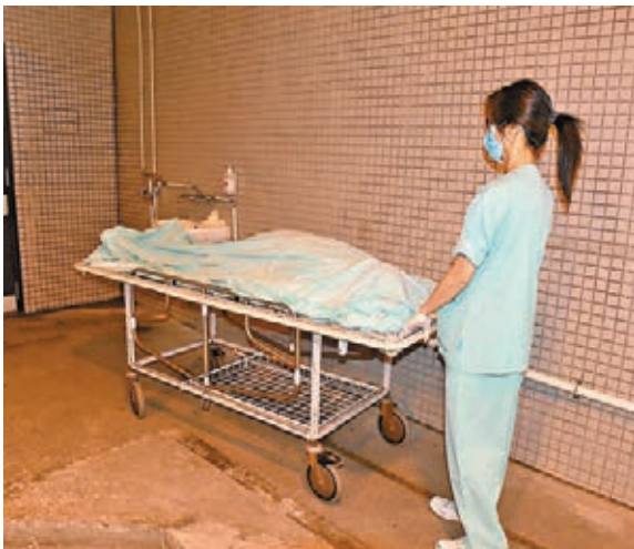
■騎單車男子途中猝死，遺體昇送殮房待驗死因。

有心臟科專科醫生指，踏單車屬中度帶氧運動，高血壓患者在天氣炎熱情況下進行劇烈運動，會對心臟造成過度壓力，加重心血管負擔，隨時有機會誘發發血管、中風或心臟病等導致生命危險。故建議高血壓患者應向