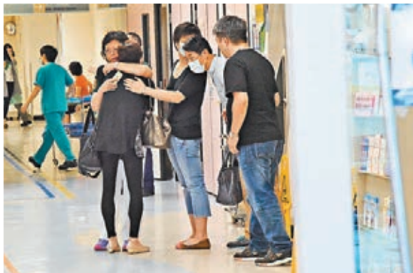
■猝死男子的親友趕抵醫院，聞噩耗相擁痛哭。

由於昨日天氣酷熱，事主本身患有高血壓，警方不排除他因酷熱病發猝死，事件暫列作致命交通意外，交由港島總區交通部特別調查隊跟進。