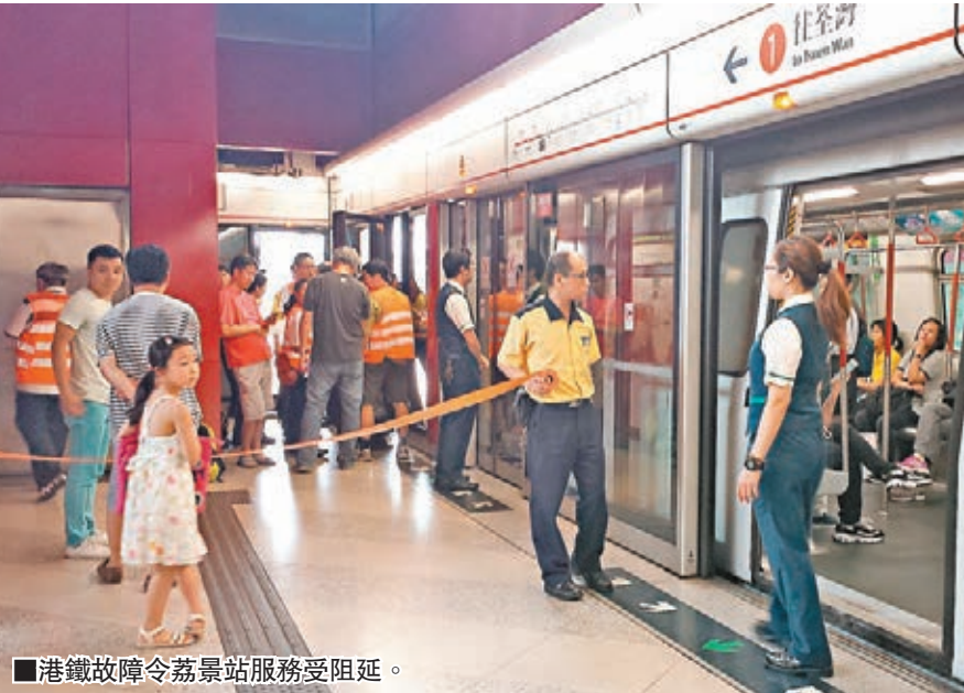
■港鐵故障令荔景站服務受阻延。