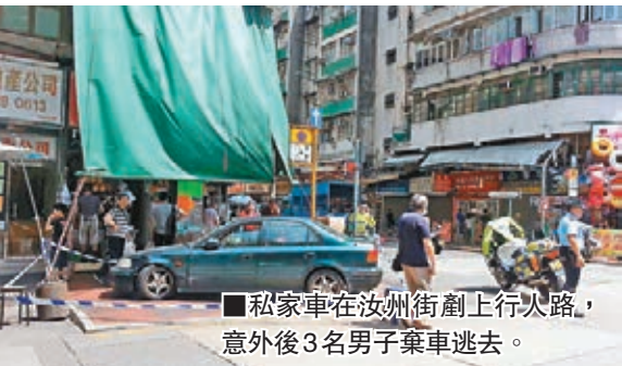
■私家車在汝州街剷上行火路，意外後3名男子棄車逃去。

另外，一名26歲女子昨晨10時許偕男友行山，下午近3時，當兩人步抵西貢北港後，女子疑難耐酷熱出現頭暈中暑跡象，男友見狀立即報警，由救護車將她送往醫院治理。