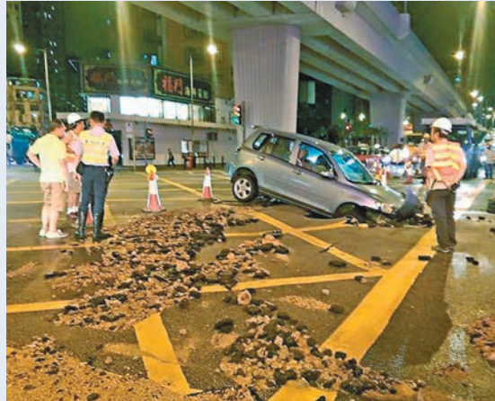
■旺角道與塘尾道交界爆水管致私家車墮坑。

香港文匯報訊（記者 杜法祖）旺角塘尾道與旺角道交界前晚深夜發生食水管爆裂，大量食水及沙石沖毀路面，59歲姓唐司機駕駛一輛私家車駛經時路面突然下陷，私家車前輪跌入地窿，司機飽受驚嚇。工人通宵搶修，至昨晚才修復爆裂水管及重鋪路面。水務署發言人表示，肇事原因仍有待調查，而發生意外私家車車主可以書面向水務署申請索償。