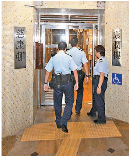
■警員到淋腐液案發大廈調查及蒐證。