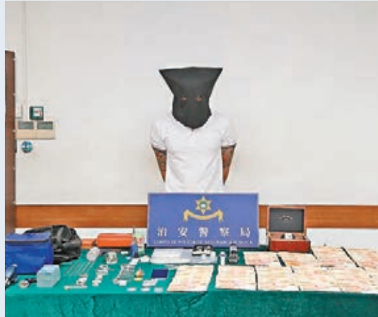
■澳門治安警拘涉毒品案台灣男子。

香港文匯報訊（記者 杜法祖）一名台灣人涉過去7年偷渡往來內地和澳門，流連各賭場耍樂，更因籌錢賭博而淪為毒販。他日前攜帶毒品乘的士，至氹仔舊大橋附近遇警截查時襲警企圖逃走，最後被制服，警方在其身上及租住的酒店內檢獲近半公斤冰毒、可卡因、「K仔」等毒品，市值157萬元，警方正追查毒品來源。